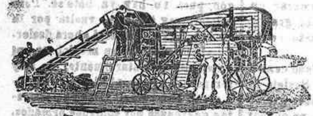
Trilladora Triunfo chica