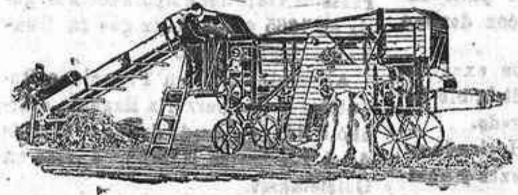
Trilladora Triunfo chica

Para labores grandes: Trilladoras Lanz de 4½ y 5 pies de ancho con locomóviles de igual marca. Rendimiento diario de 42 a 46 y de 50 a 55 carretadas.