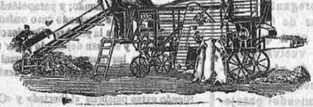
Trilladora Triunfo chica