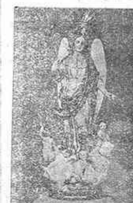
Artículos religiosos Imágenes de las mejores marcas de Olot. ANTONIO ZAFRA Conde de Cárdenas núm. 20

Médico por oposición del Cuerpo de Fisiología VIAS URINARIAS—CIRUGIA Consulta de 12 a 2 y de 4 a 6 Ambrosio de Morales, 1