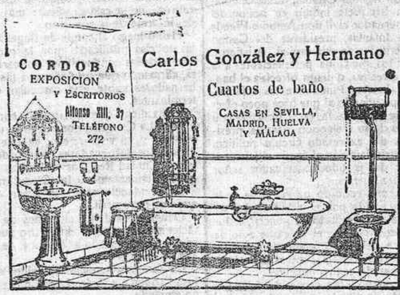
CORDOBA EXPOSICION Y ESCRITORIOS ALONSO XIII, 37 TELÉFONO 272

Folleto y muestras, al Representante para Córdoba: DON JOSÉ TORRALBA, - Villa del Río