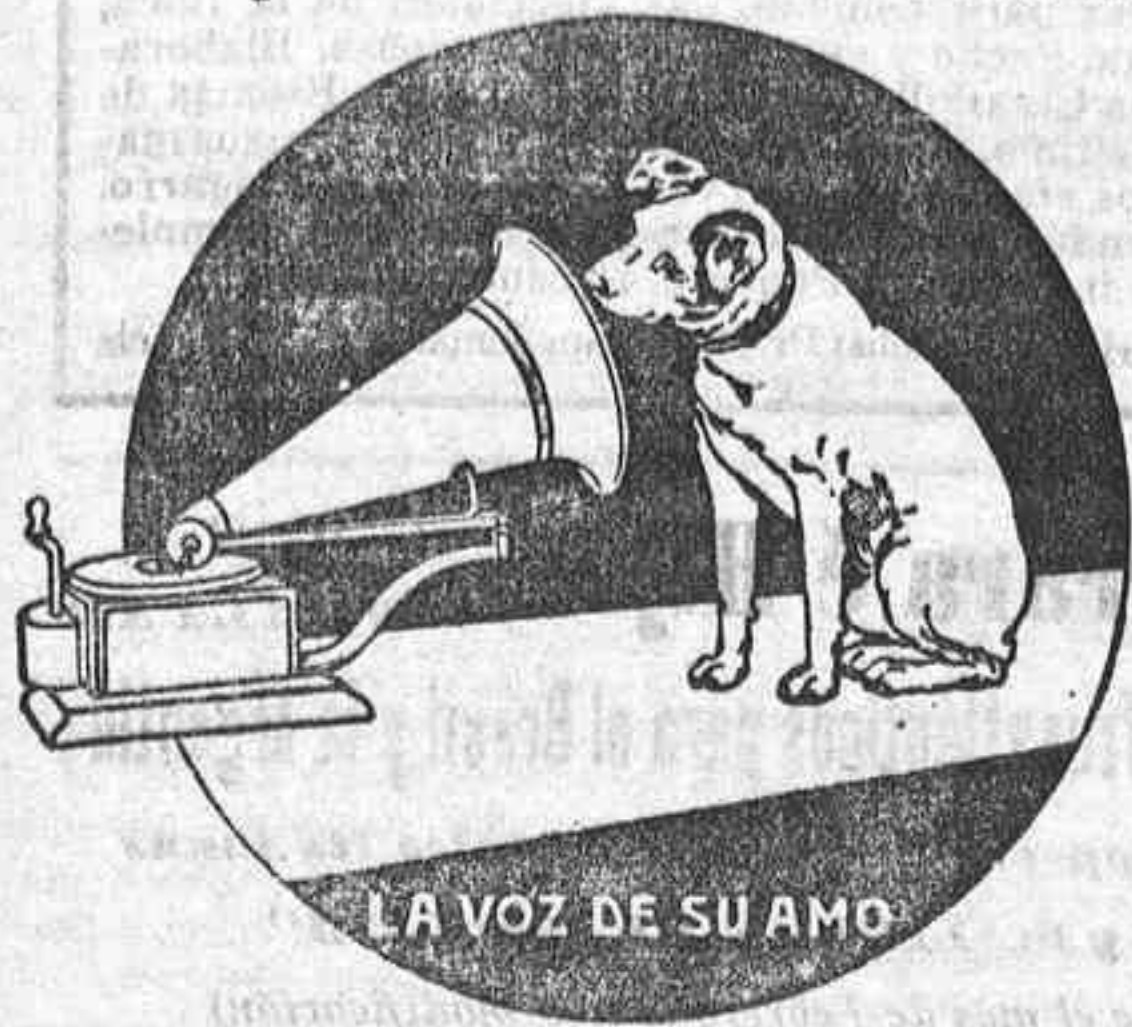
LA VOZ DE SU AMO

Representante de la casa Piazza de Sevilla