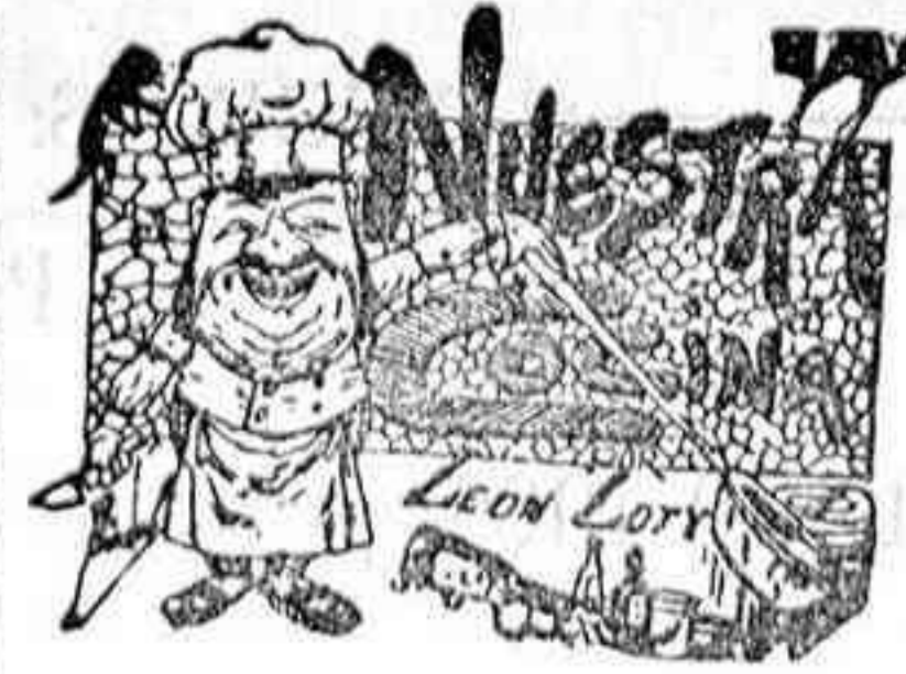
Comi las para el 19 de Febrero

Lo que se anuncia para conocimiento de los señores asociados á dicha Hermandad, enareciéndoles la puntual asistencia á la mencionada reunión.