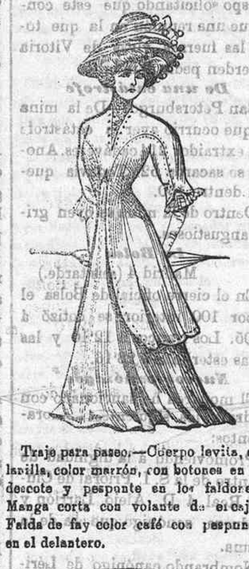
Traje para paseo.—Cuerpo levita, de lavilla, color marrón, con botones en el descote y pespunte en los faldores. Manga corta con volante de encaje. Falda de say color café con pespunte en el delantero.