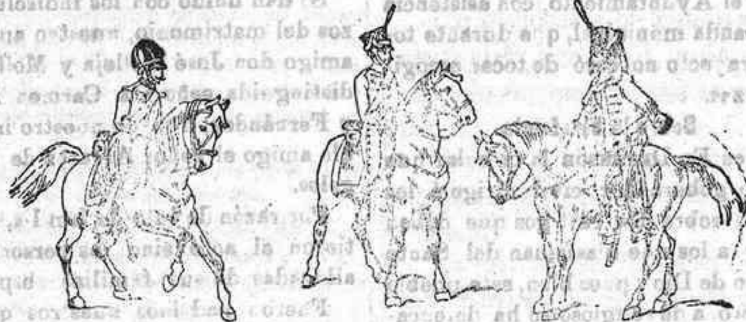
Soldados y oficial de caballería

Virgen sin máscara, que bajo la advocación de María Auxiliadora, ha de ser consuelo para los afligidos y auxilio espiritual para todos aquellos, en cuyo pecho anida la devoción a esa imagen.