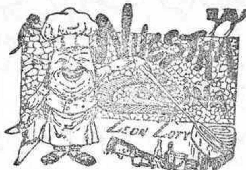
Comidas para el 10 de Septiembre