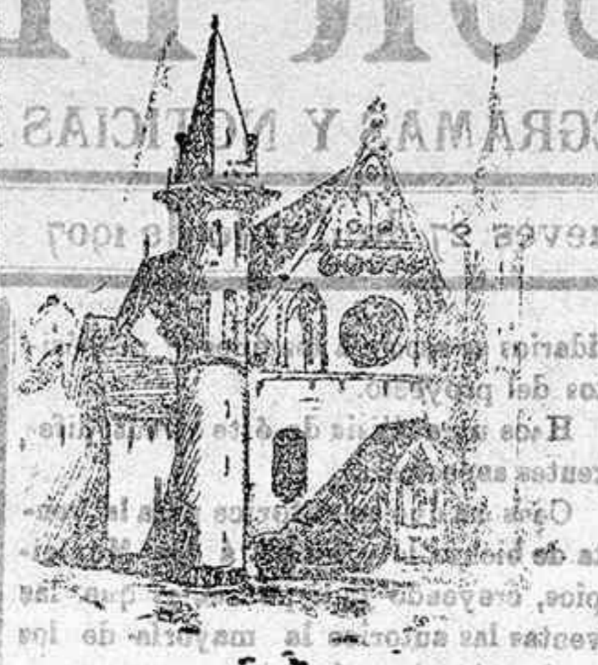
Castillo de Rittersaal donde se celebró el Congreso

les consagrados a dar fin con las guerras por medio de un tribunal internacional.