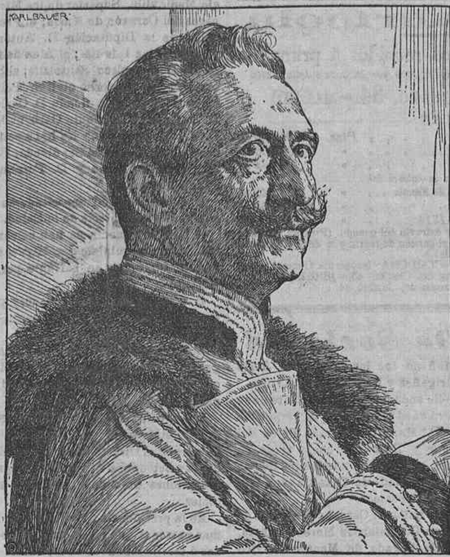
S. M. Guillermo II, Emperador de Alemania, que hoy cumple 57 años

Y después de todo, no censuraríamos muy acremente esto si de esa postura más ó menos intransigente no dependiese un problema de numerario que tan directamente afecta á la economía doméstica. No dejaría de ser educativo el procedimiento como se generalizase: que los ministros dijeran, ¡jea!, nos tumbamos á la bartola, si el país quiere algo que lo pida á gritos: cuando los gritos sean grandes ya nos despertaremos. Por lo menos nos acostumbraremos á pedir, á exigir... Por el acaso, aplaude el Sr. Urzaiz la lección de civismo... Primero, abaratan el azúcar. Después, lo otro. José Calvo Sotelo.