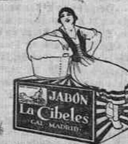
EL JABÓN LA CIBELES ES EL DESCANSO DE LA LAVANDERA

De venta en droguerías, perfumerías, bazares, mercaderías y tiendas de comestibles.