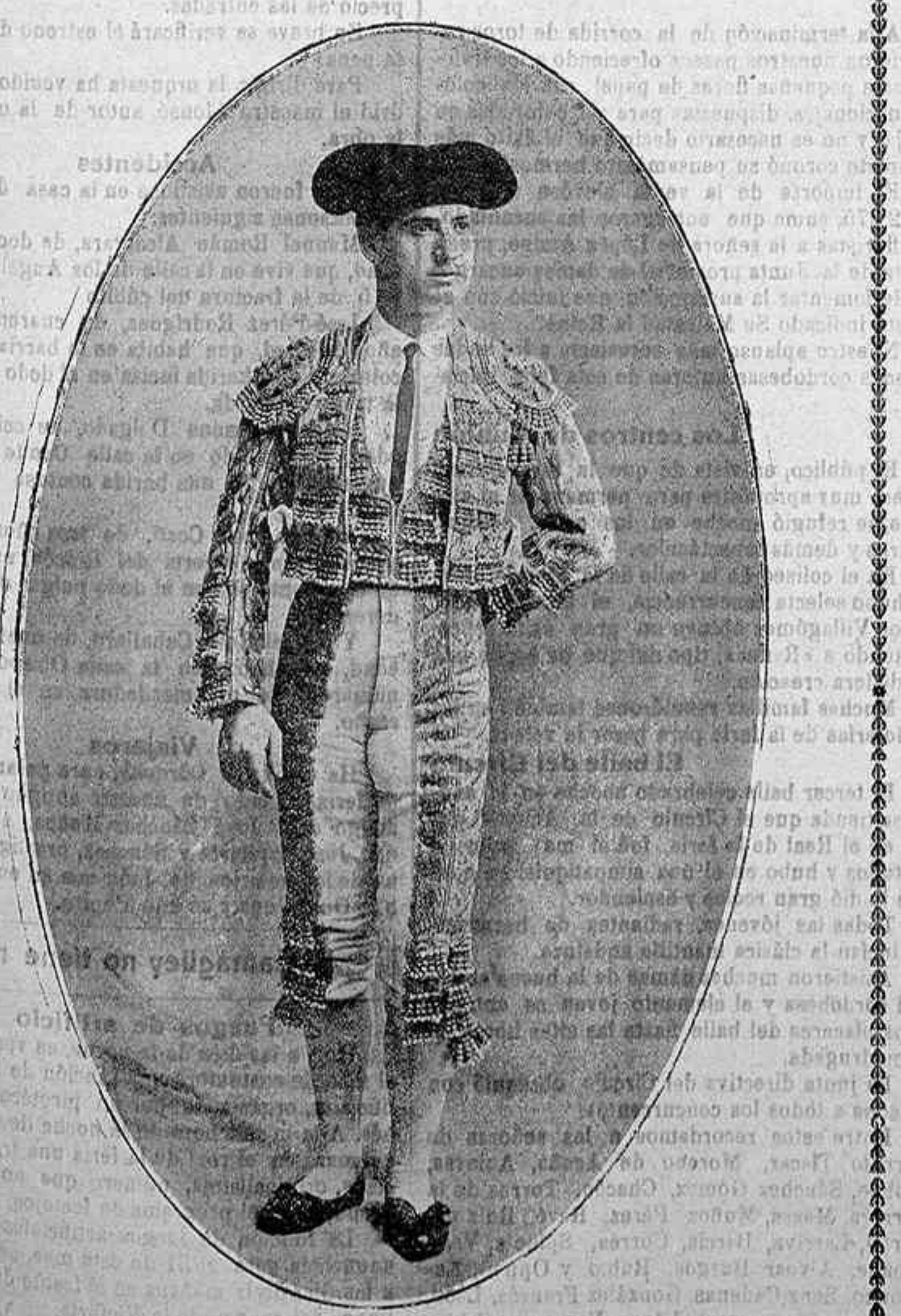
Manuel Rodríguez (Manolete)