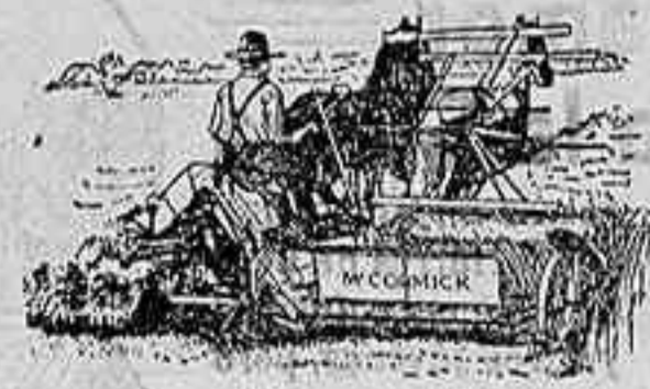
Atadoras Macormick — ULTIMA PERFECCION —