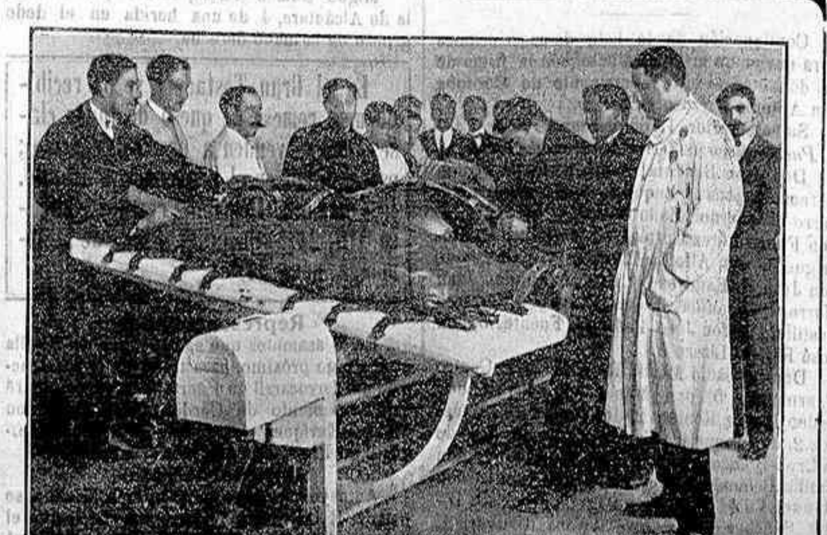
La mesa de operaciones