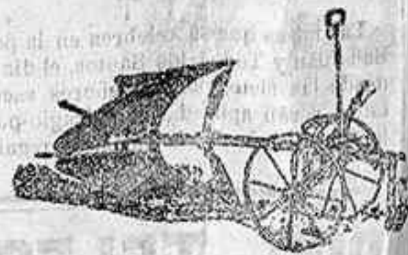
Arado Janus K. S. 1-tipo R. S. N.º 5