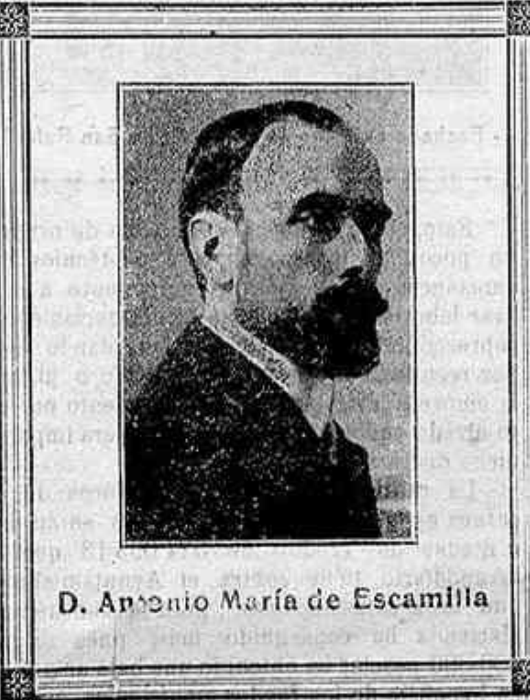
D. Antonio María de Escamilla

Ayuntamientos.—Edicto del de Córdoba invitando á los dueños de carruajes de lujo á que presenten en el negociado de arbitrios relación duplicada de los que posean.—Idem del de Santa Eufemia sacando á subasta la recaudación del impuesto de consumos.—Idem del de Zamora exponiendo al público el reparto de consumos.—Idem de los de Cañete de las Torres y Belalcázar al padrón de cédulas personales.—Idem del de Montemayor sacando á segunda subasta una casa propia del Pósito.