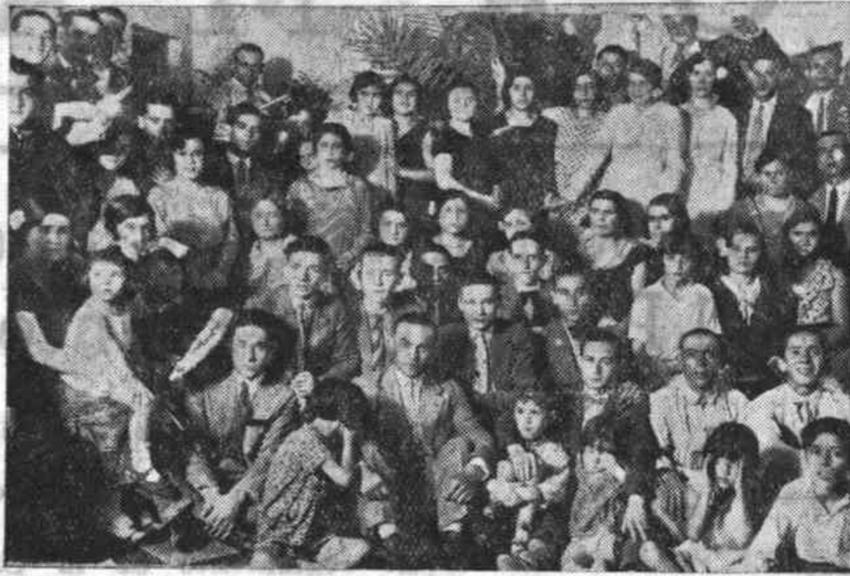
Con motivo de inaugurarse la sociedad «La Lírica Cordobesa» se celebró una clásica verbena, la que estuvo muy animada.

Puente Genil 11 Julio 1931.—Manuel López Quintero.»