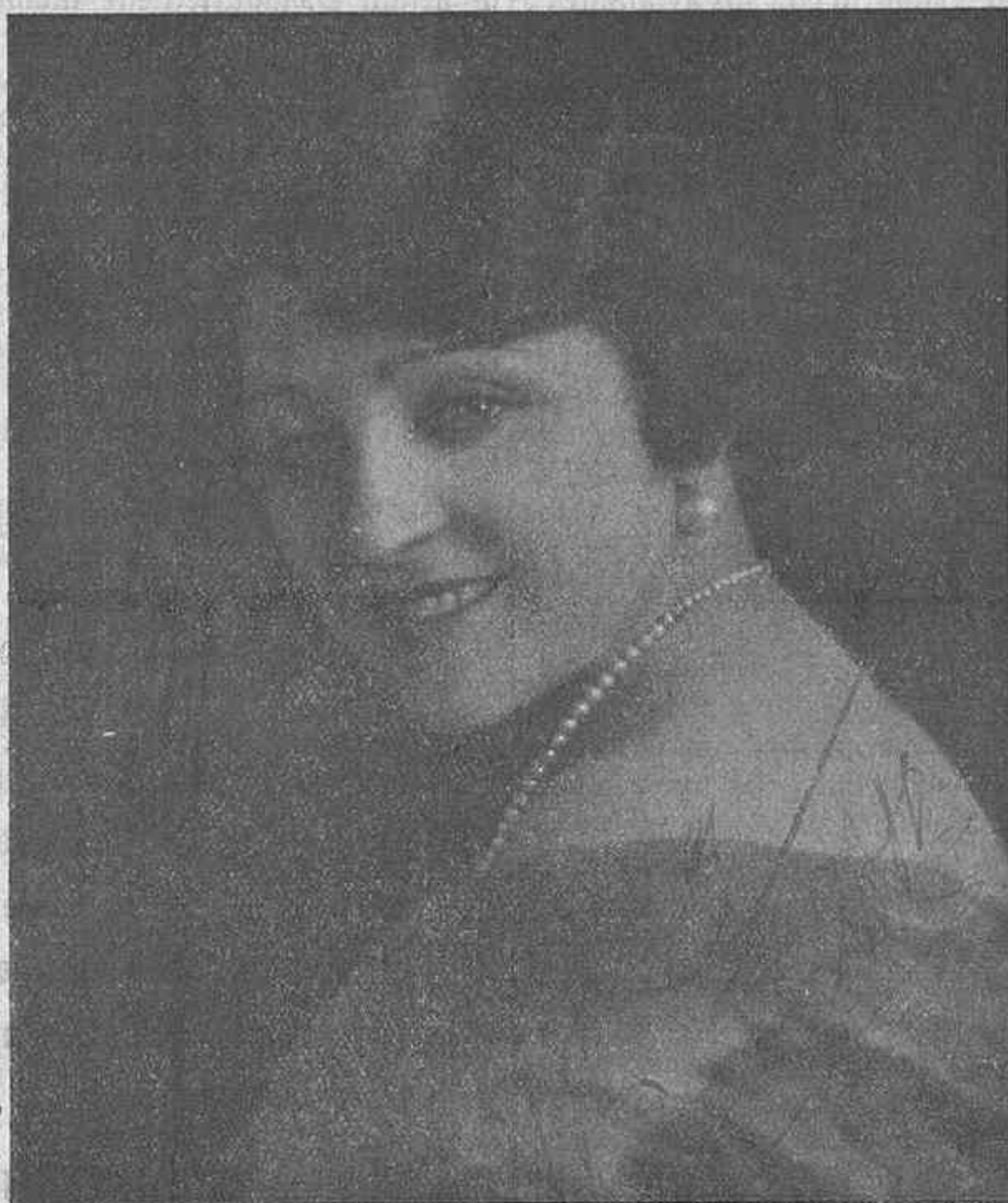
La bella y eminente actriz María Bassó, que anoche celebró con gran éxito su beneficio en el Teatro Duque de Rivas