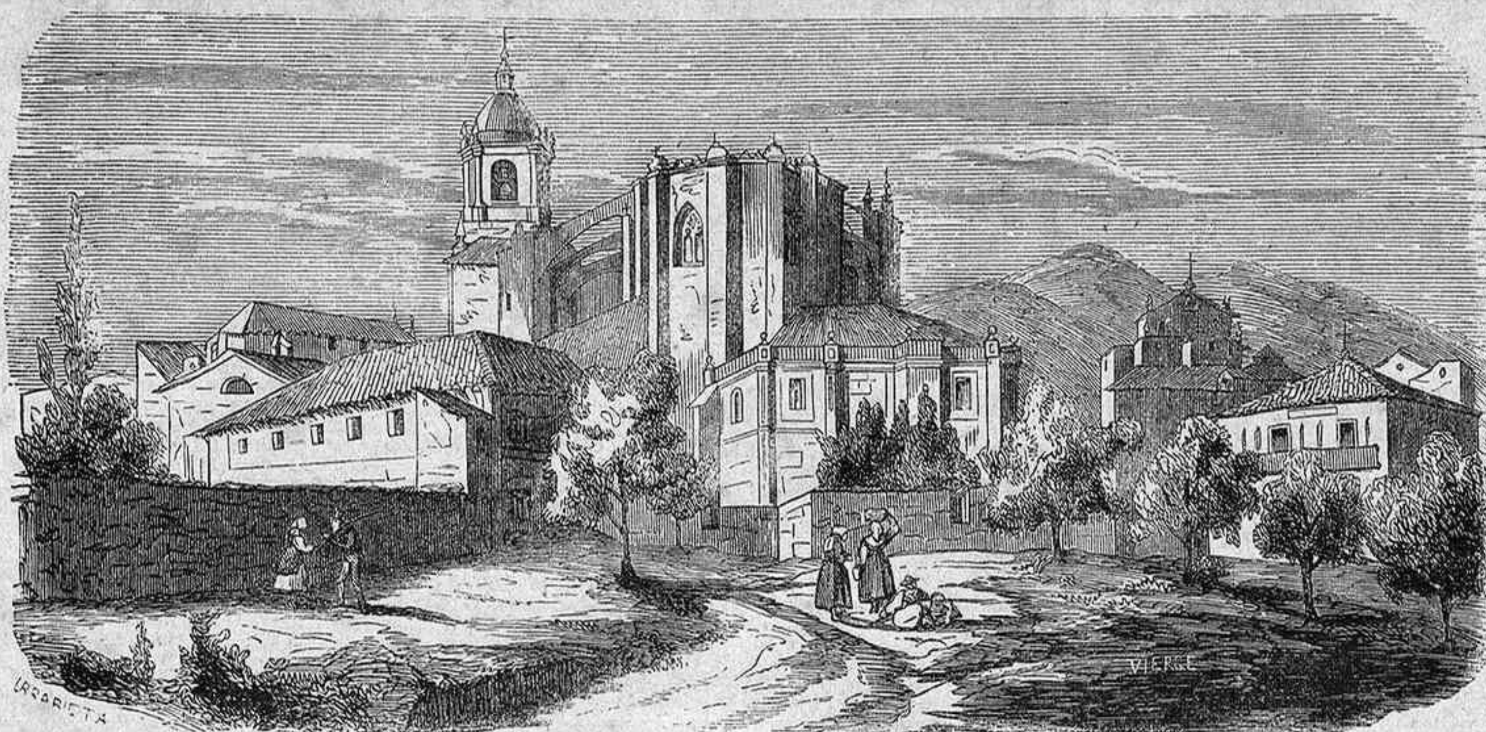
VIZCAYA.—VISTA DE LEQUEITIO.

á Inglaterra, conduce á su bordo los aparatos de alumbrado para servicio del nuevo teatro-circo.