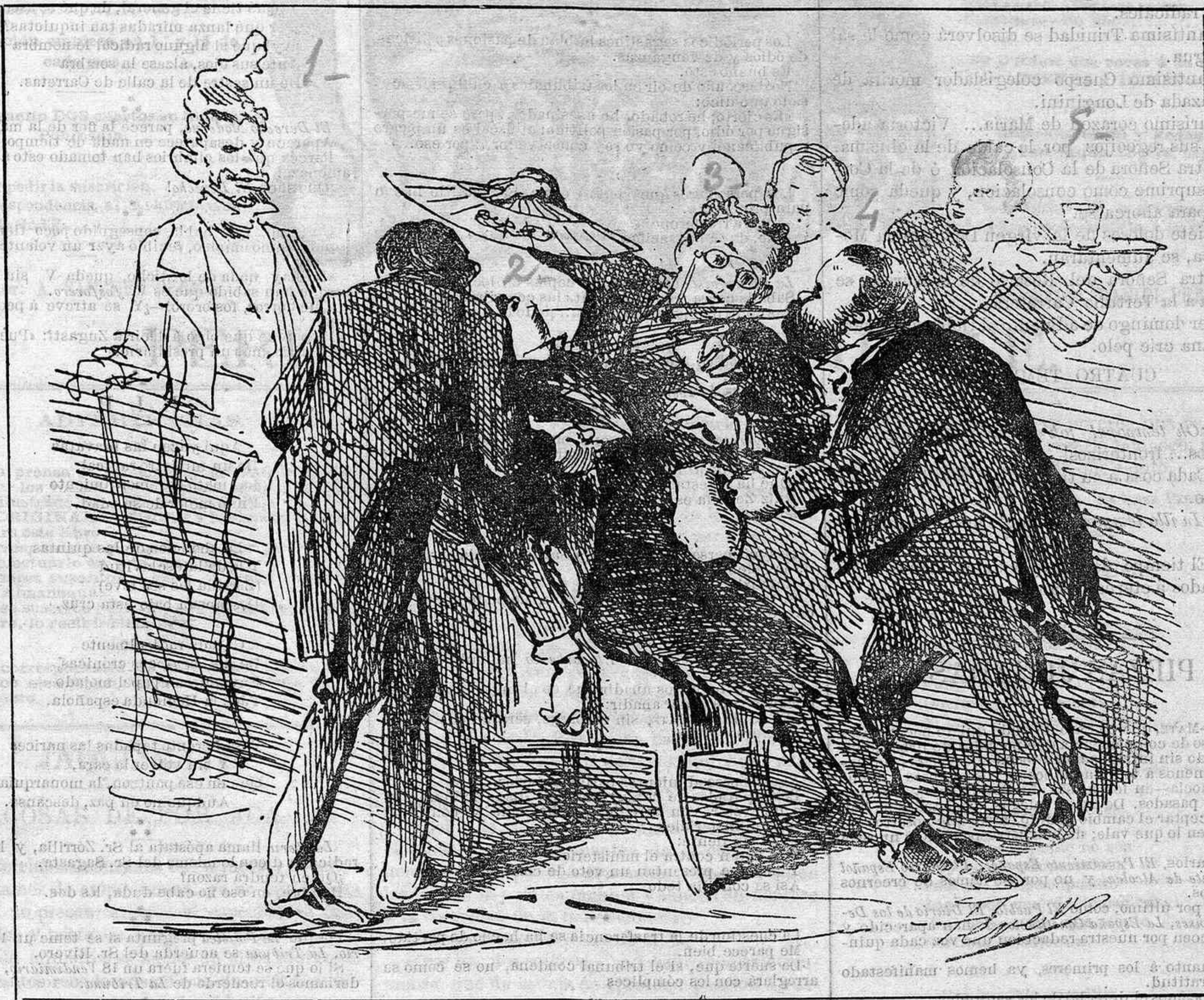
Malditas trasferencias! Socorro, auxilio—se quedó sin conocimiento—agua, aire.....