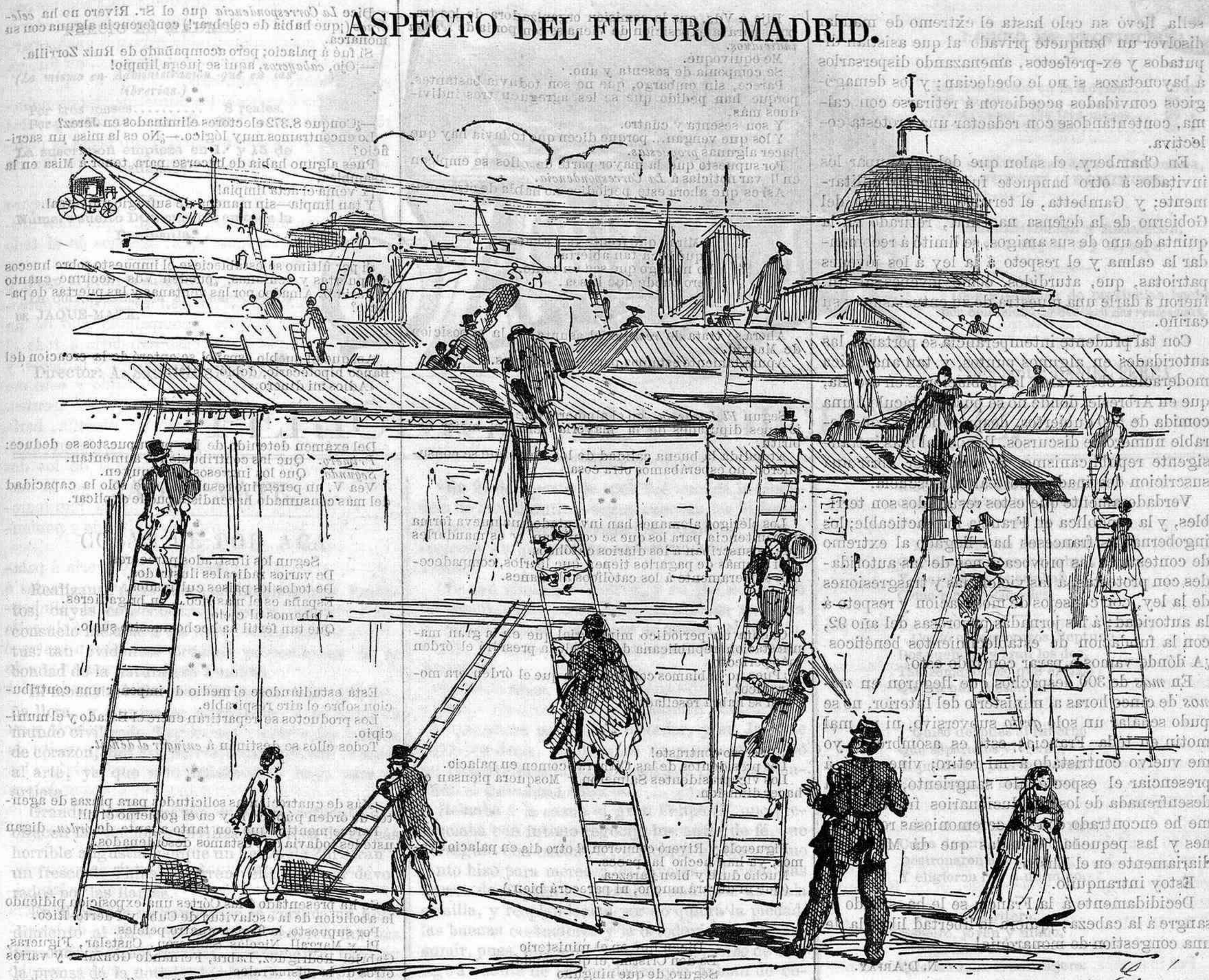
Procedimiento cómodo y sencillo que aplicará el vecindario cuando no pueda pagar el impuesto sobre puertas y ventanas.

corazón que una hermana endosa á otra hermana; un amor que varia de domicilio desde Esperanza á Consuelo , no es, no puede ser, no debe ser el amor dramático.