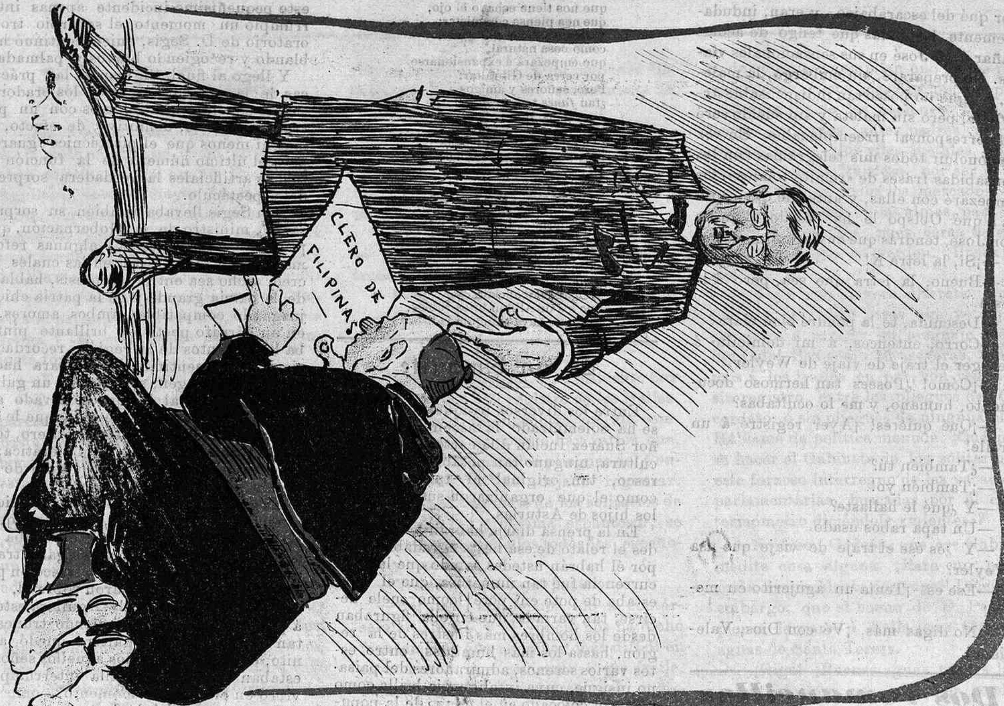
Con la protestante ganquilandia.