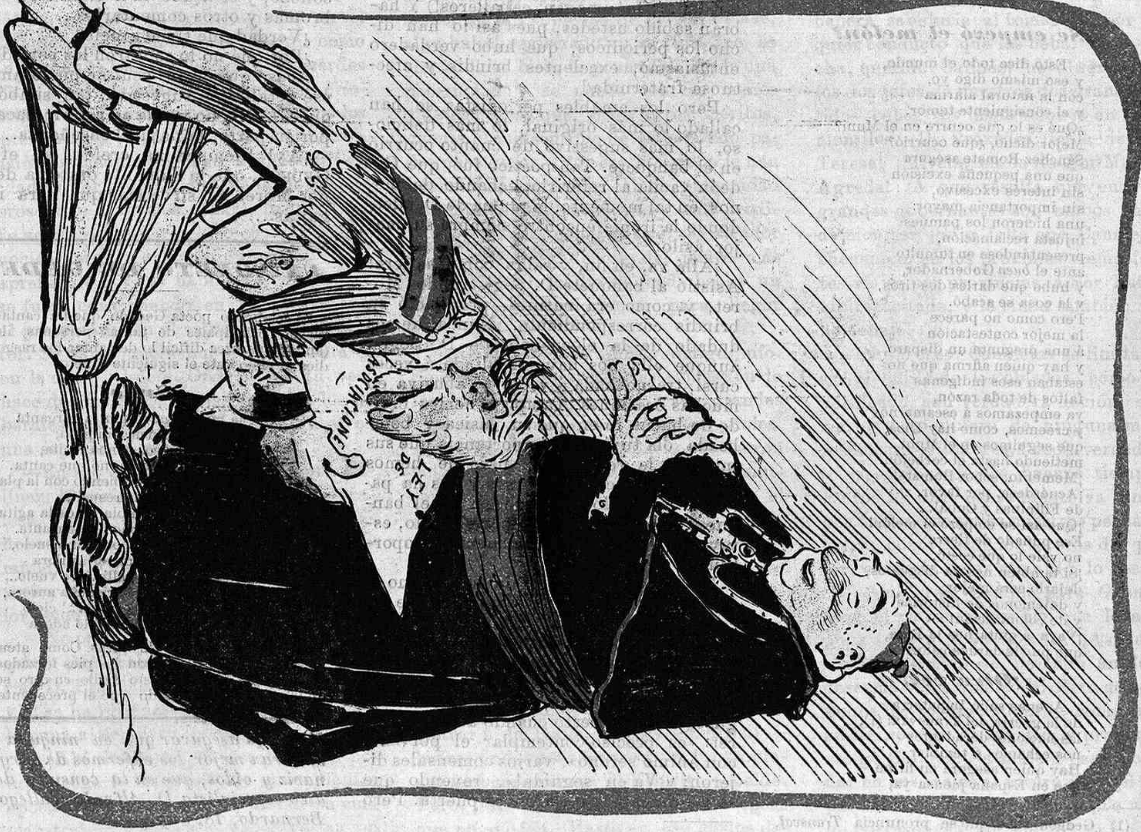
Con la catolica España.