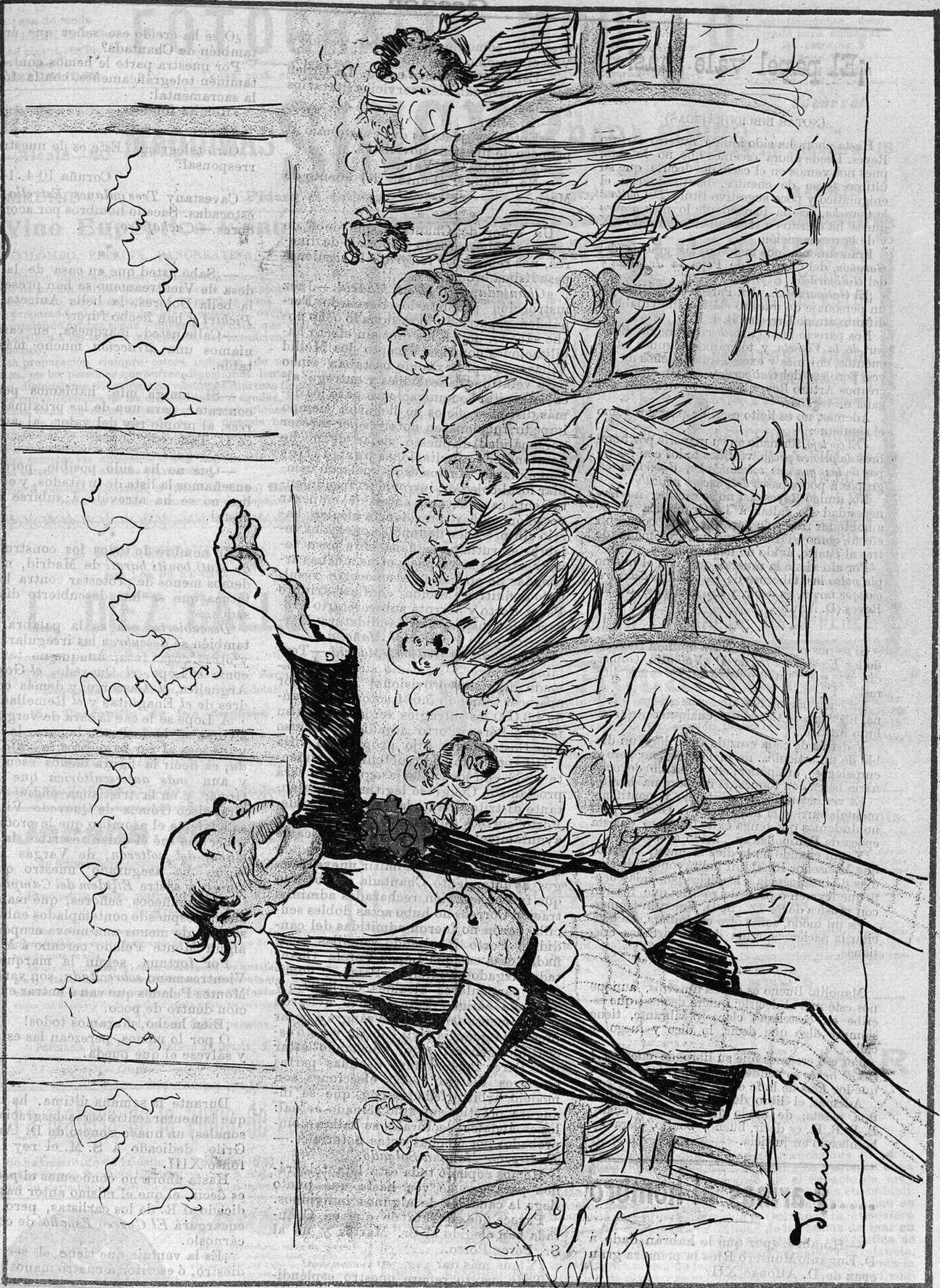
—Señores, yo tengo el remedio seguro contra las sequías. Anunciar la fiesta náutica del Retiro.