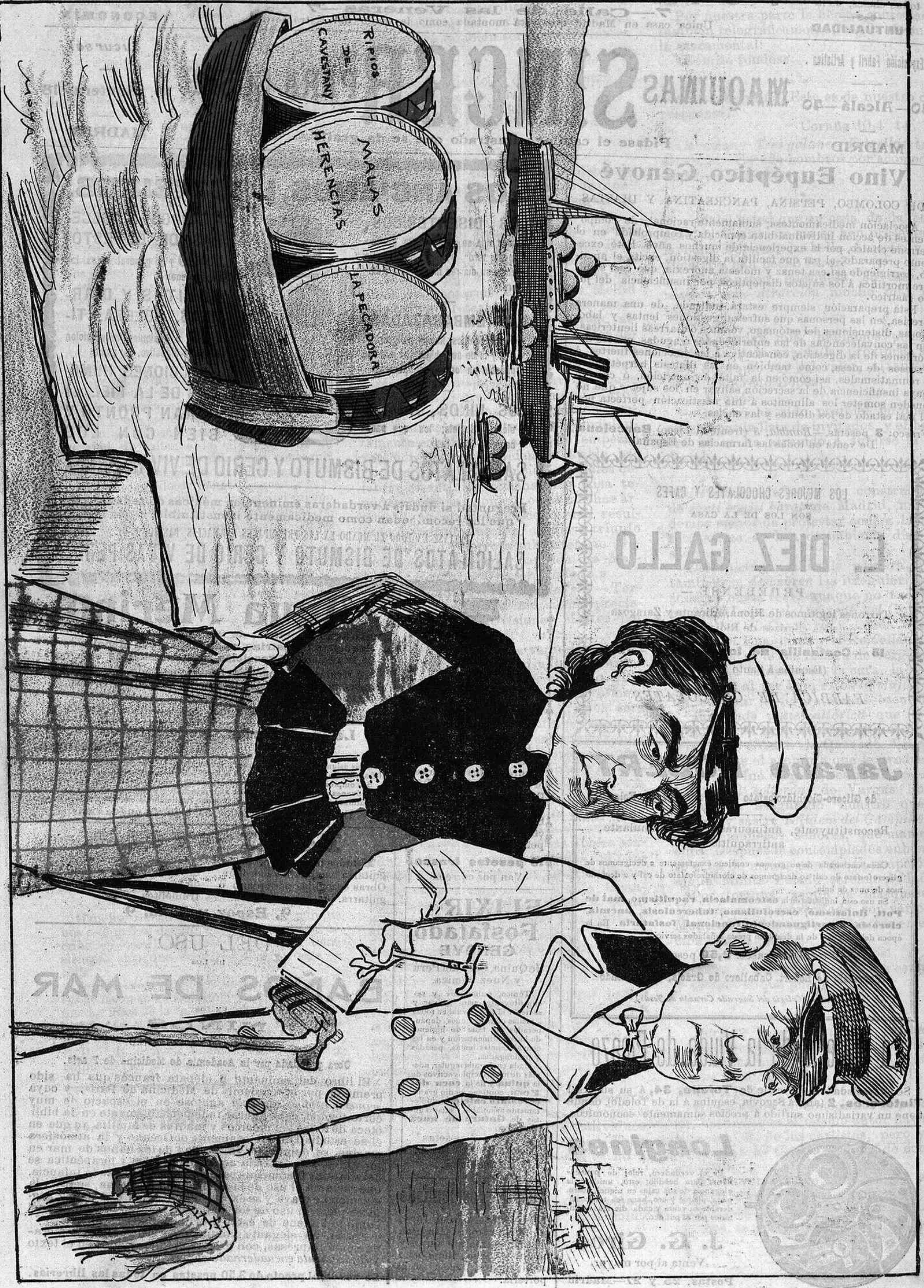
Regresaron a España con varias carabelas cargadas de...