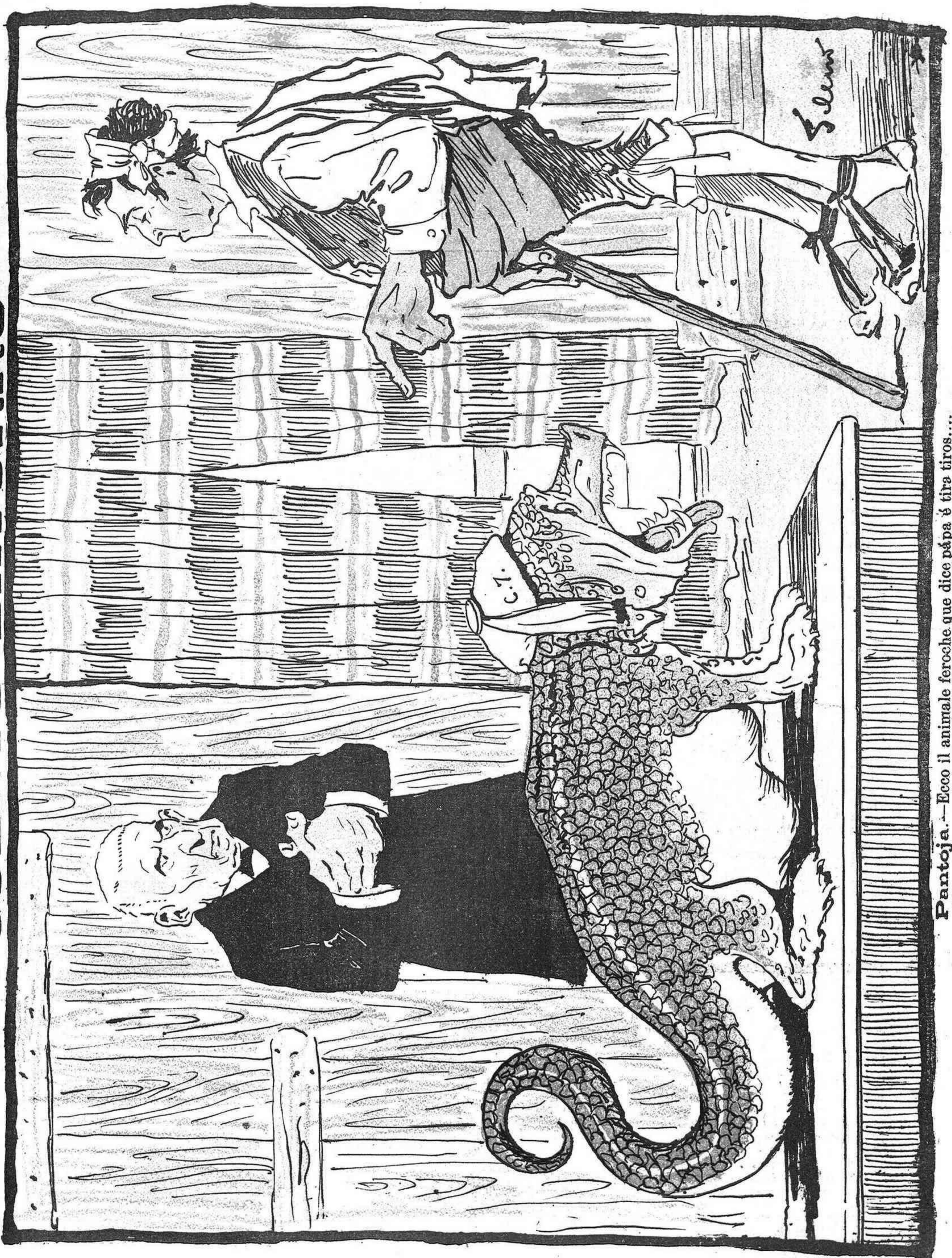
Pantoja. — Ecco il animale feroche que dice pápa é tira tiros.... El baturro (escamado). — ¡Me paice á mí que á tú y al fardacho us voy á moler.