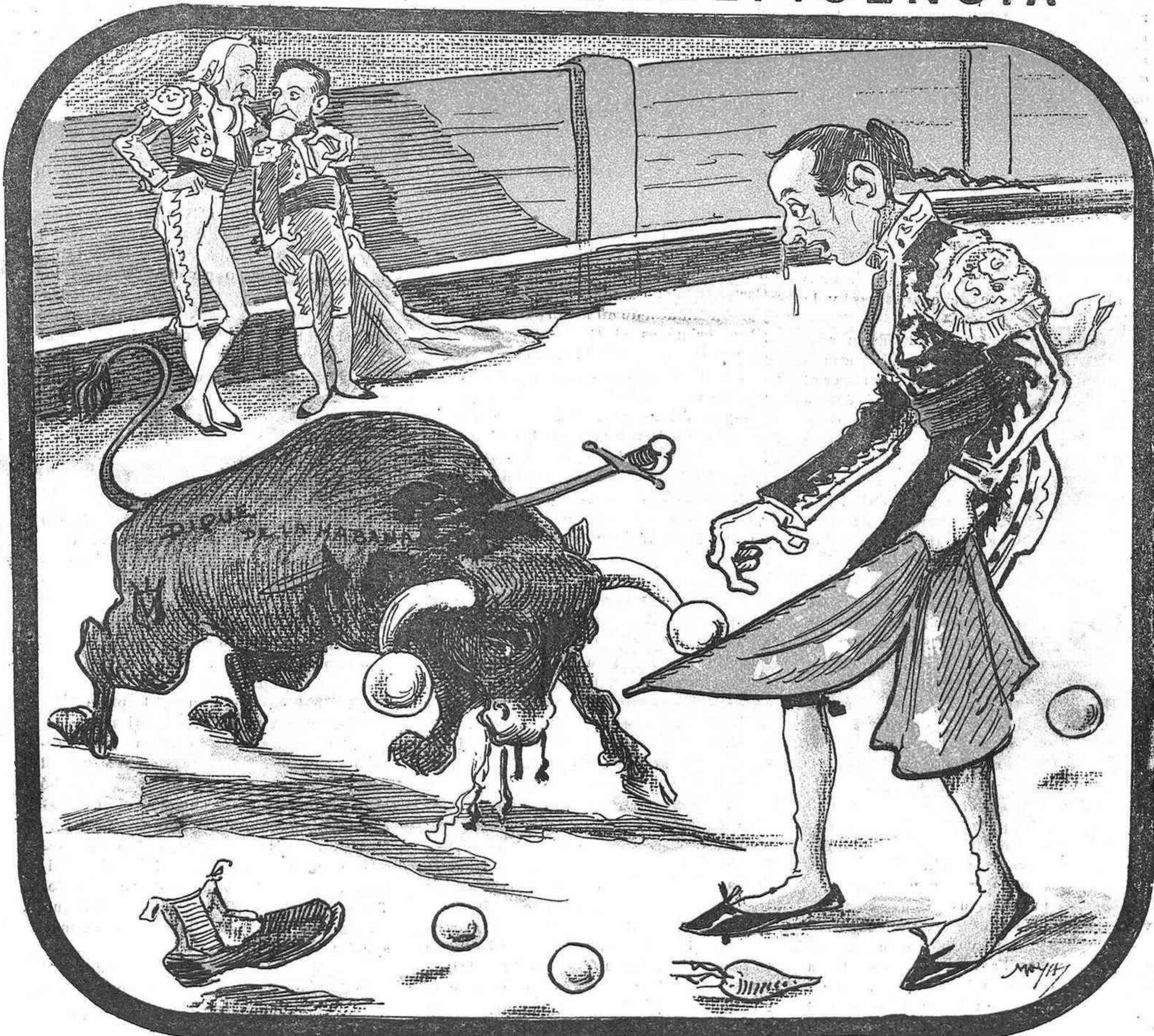
El conocido novillero el Aznar , después de pasar muchas fatigas, se deshizo del dique de una superior !!!recibiendo!!!