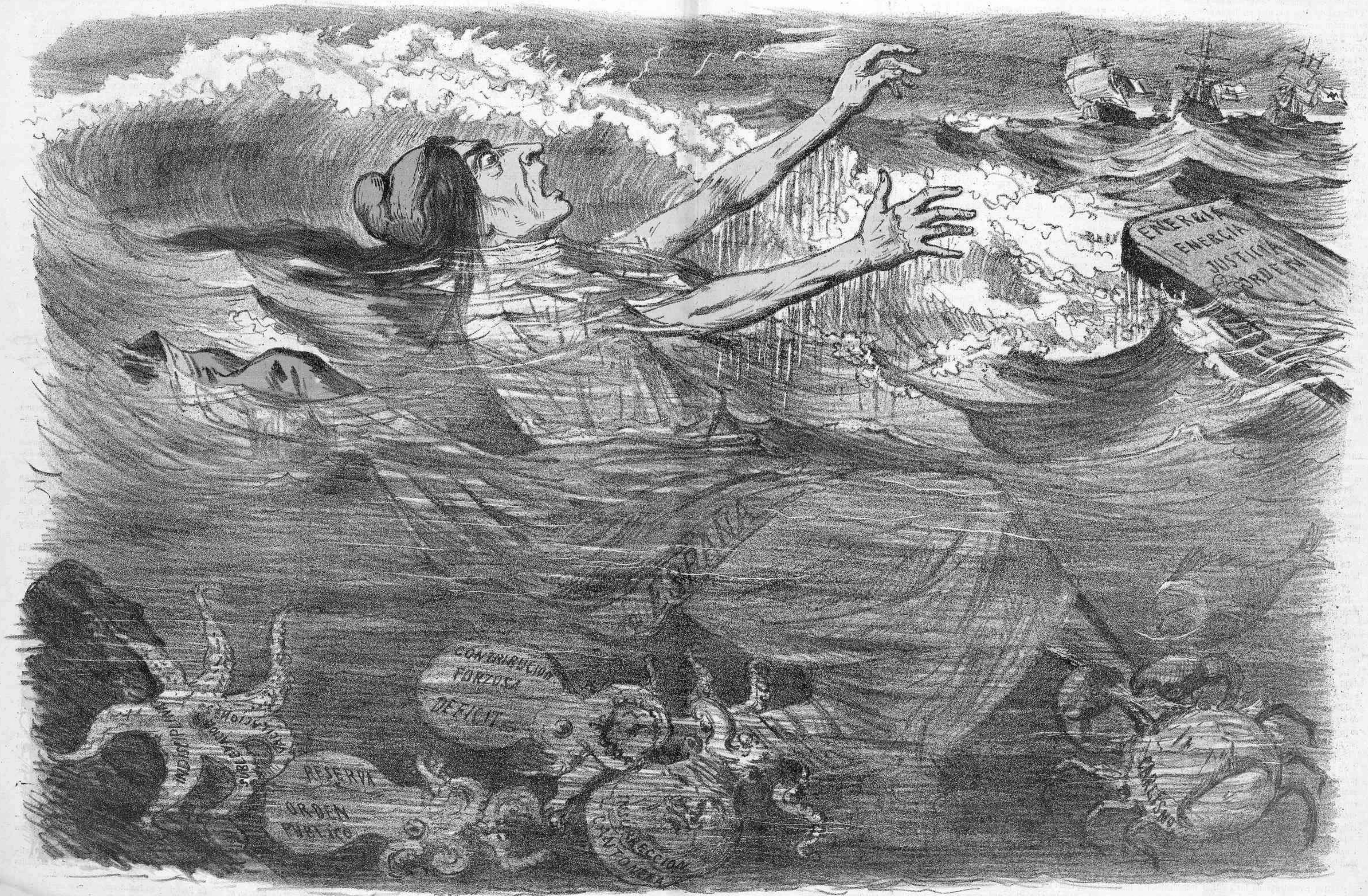
UNA SITUACION APURADA.