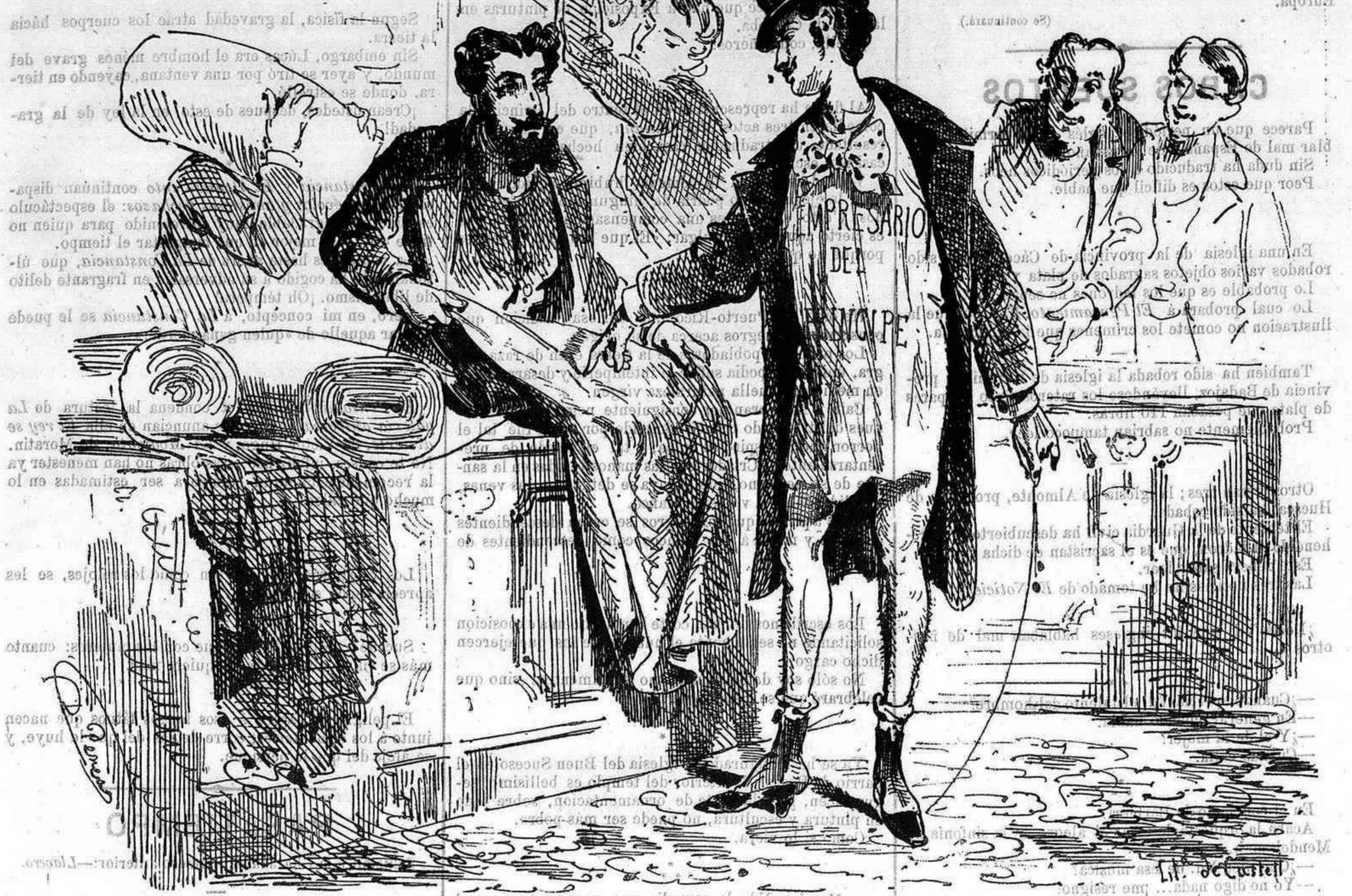
CHARADA—Del mismo paño de La Levita necesito que me haga Vd. pantalon y chaleco para tirar hasta el verano.

Sección de todo pasto, llevada siempre un vaso en el bolsi- lo y se hace seguir por una cabra, á la cual ordenada en cualquier sitio público ó privado. Se duermen espantado y escriben dormidos. El dominante de puro franco, frotado de puro bueno y léis sin darse cuenta de ello. La redacción del periódico que dirige es la primera de Europa.