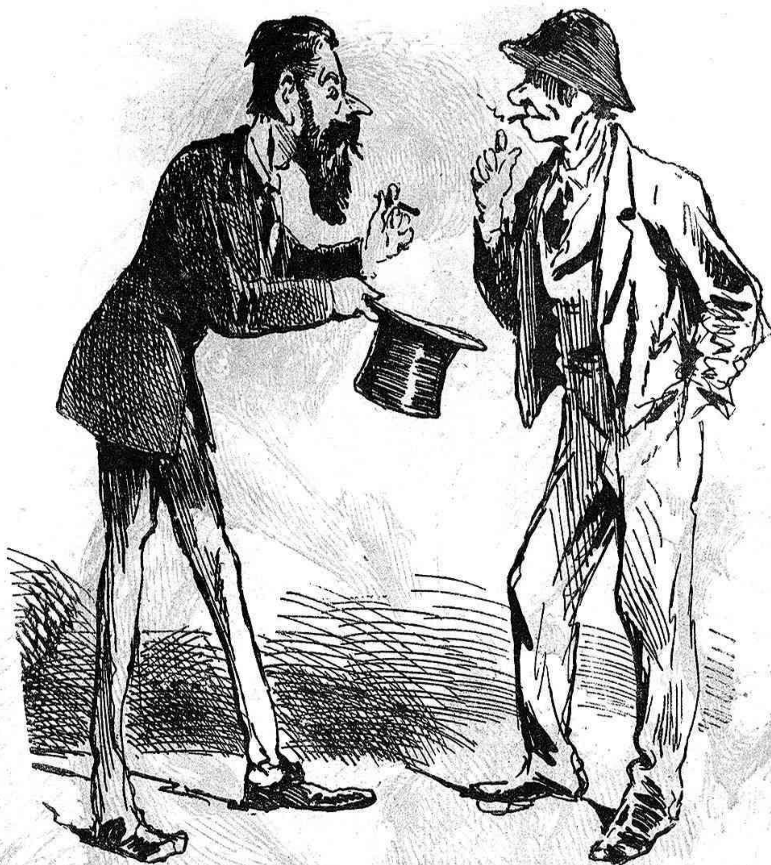
Cuando se aspira á ser diputado.

desde la víspera distribuidas con precision las horas de trabajo que ha de destinar á la reparacion de objetos.