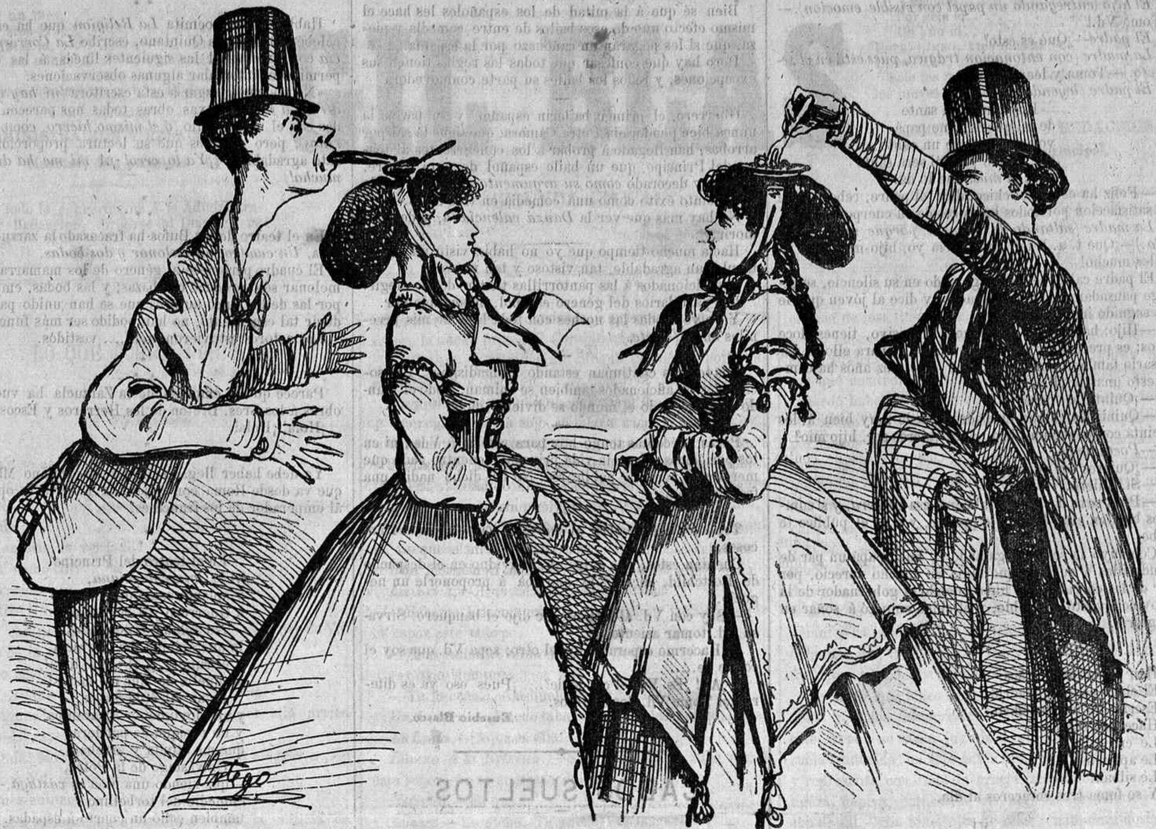
Utilidad de los sombreros de platillo, en su aplicacion á la economia doméstica. Además del braserillo y el plato de dulce, las señoras podrán llevar un tintero. Así se facilitará el medio de hacer una declaracion amorosa.