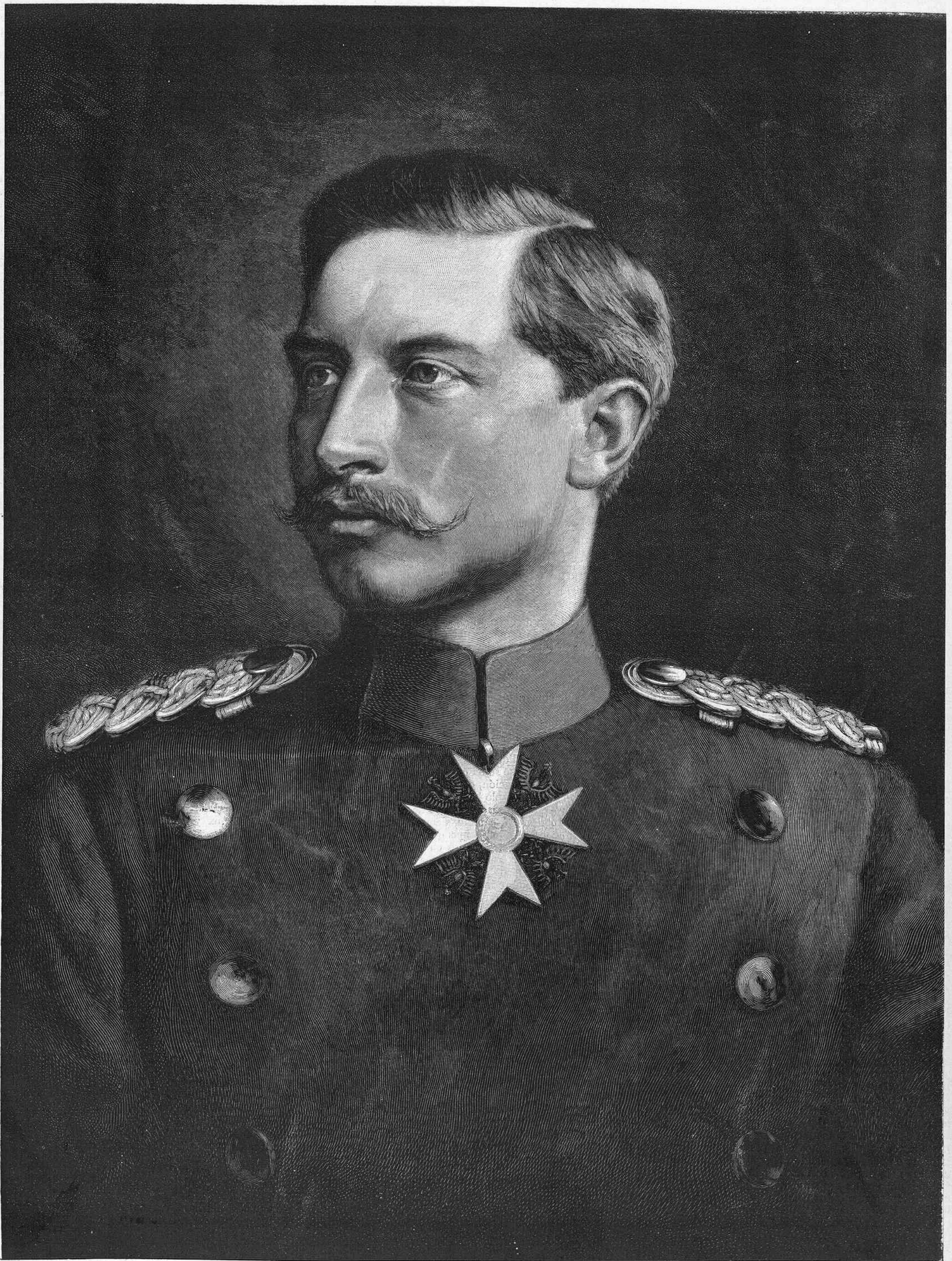
EL EMPERADOR GUILLERMO II