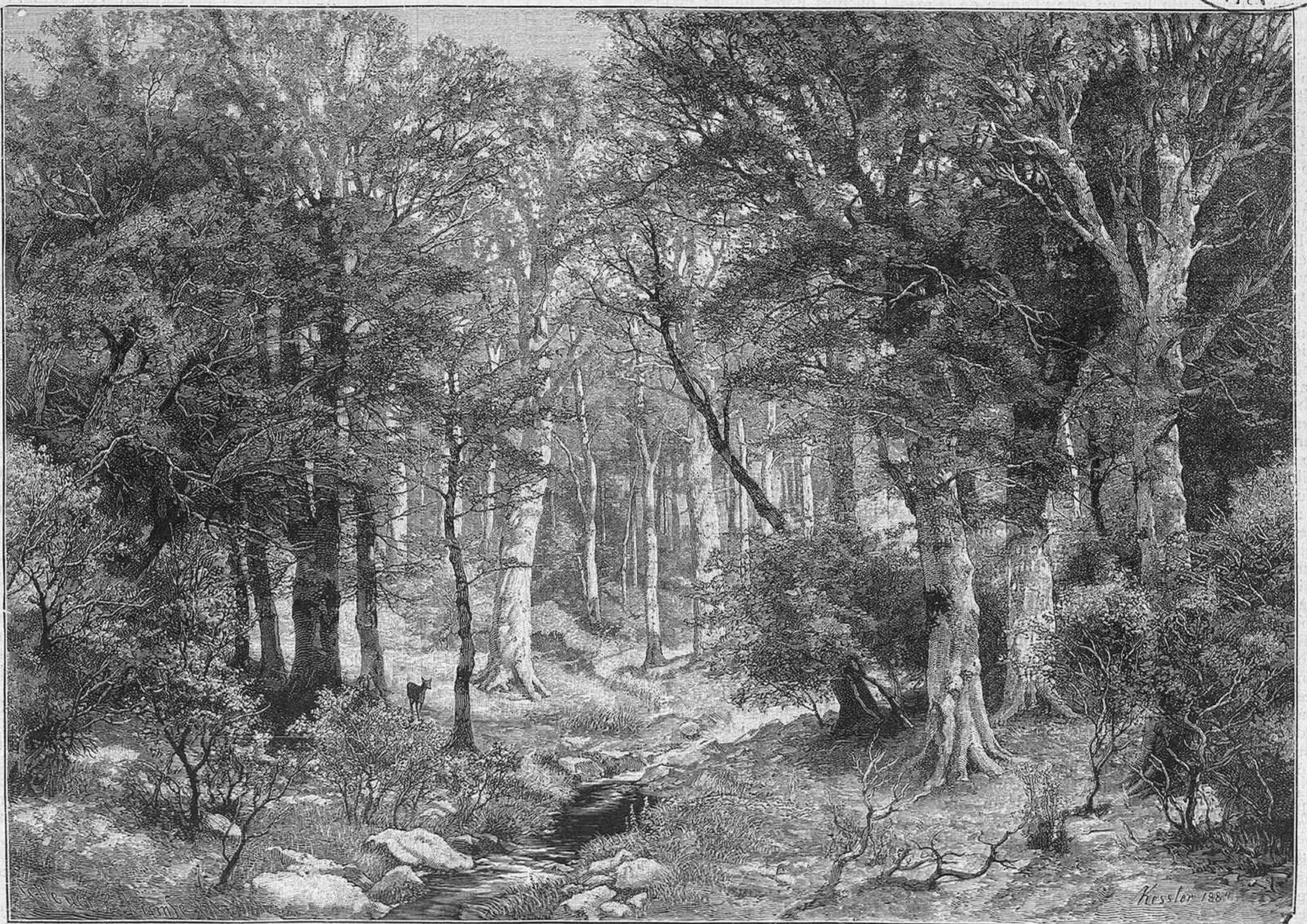
EN LA SELVA DE YDAR, por A. Kessler

ALFONSO CIENTIFICO, LITERARIO Y ARTISTICO MADRID BIBLIOTECA