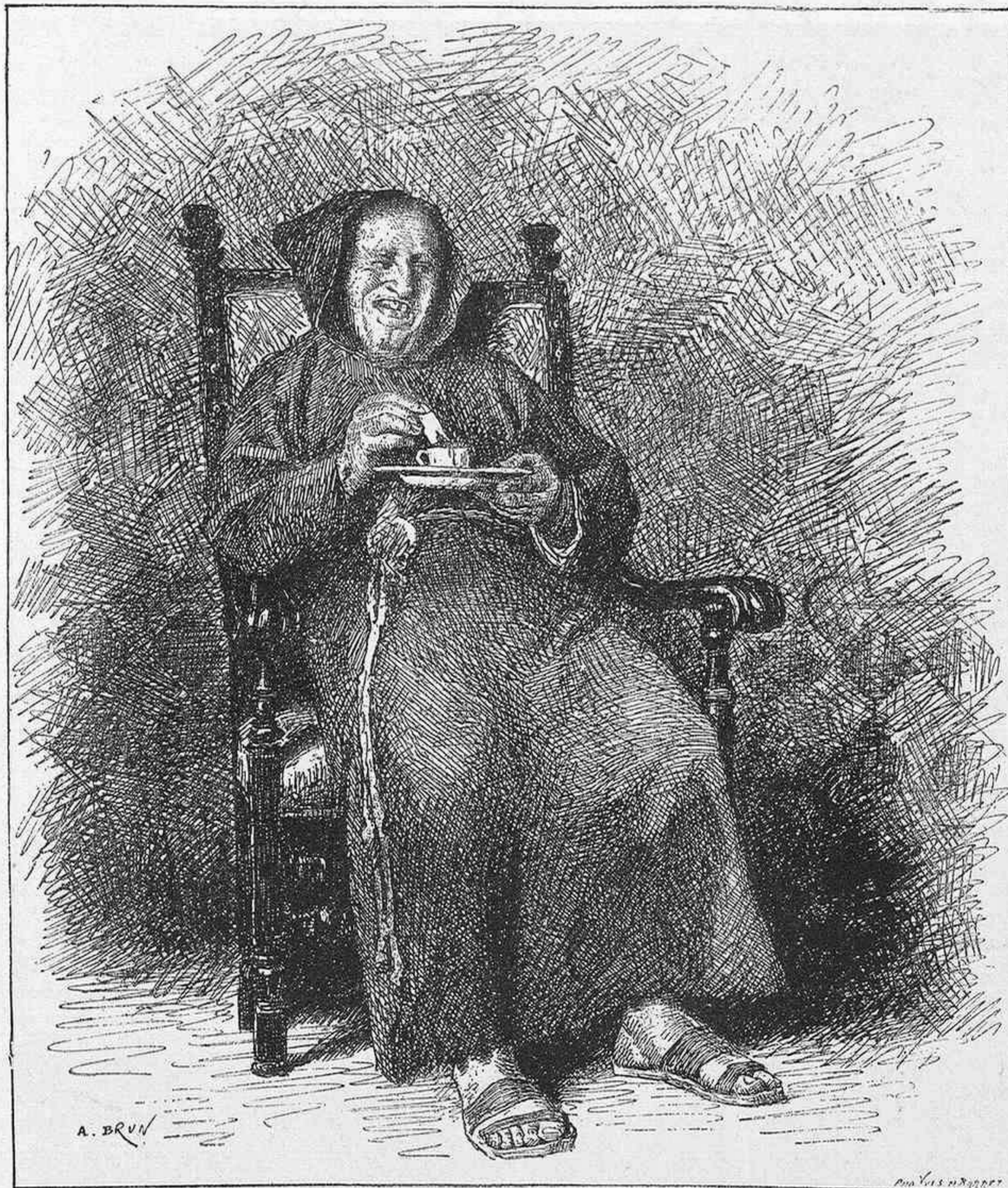
EL CHOCOLATE, copia de un cuadro de Casanova

La verdad es que parecía un angel. Aquellos ojos de un azul profundo; aquel cabello castaño, lo bastante claro para tener todos los reflejos del oro y lo suficientemente oscuro para acentuar sus delicadas y correctas facciones,