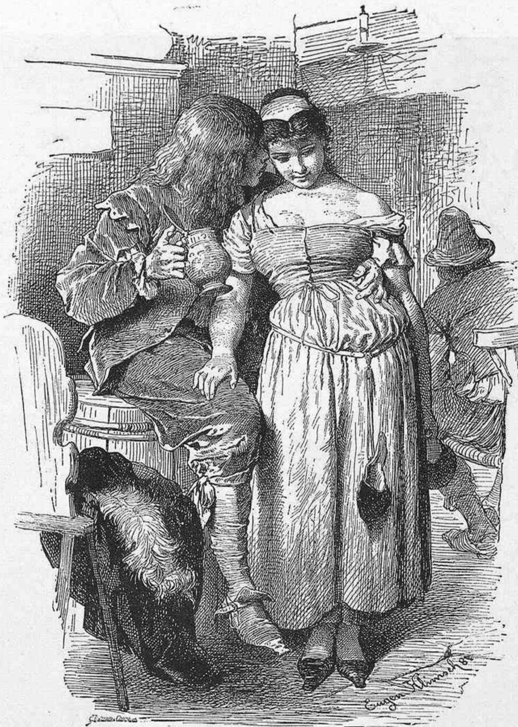
AMORES JUVENILES, dibujo de Eugenio Kleinsel.

Esos certámenes universales se han prodigado sin razón. En un principio, las naciones concurrieron á ellos generosamente, con el desprendimiento hidalgo del que acepta de buena fe la invitación para una fiesta, que paga harto cara en gastos hechos para presentarse convenientemente en ella. Mas cuando los pueblos sagaces, y Bélgica lo es sin duda, se han convencido de que las Exposiciones universales se iban convirtiendo en reclamo para atraer simplemente la atención hacia un punto determinado de Europa, han hecho lo que aquellas madres que solo llevan sus hijas casaderas á los bailes donde se prometen hallar novios apetecibles. Y he aquí como lo que empezó por ser objeto de ostentación y lujo ha degenerado, bajo cierto punto de vista, á un simple medio para ensanchar la parroquia de cada producto. Varios son los escritores que han comparado las últimas Exposiciones