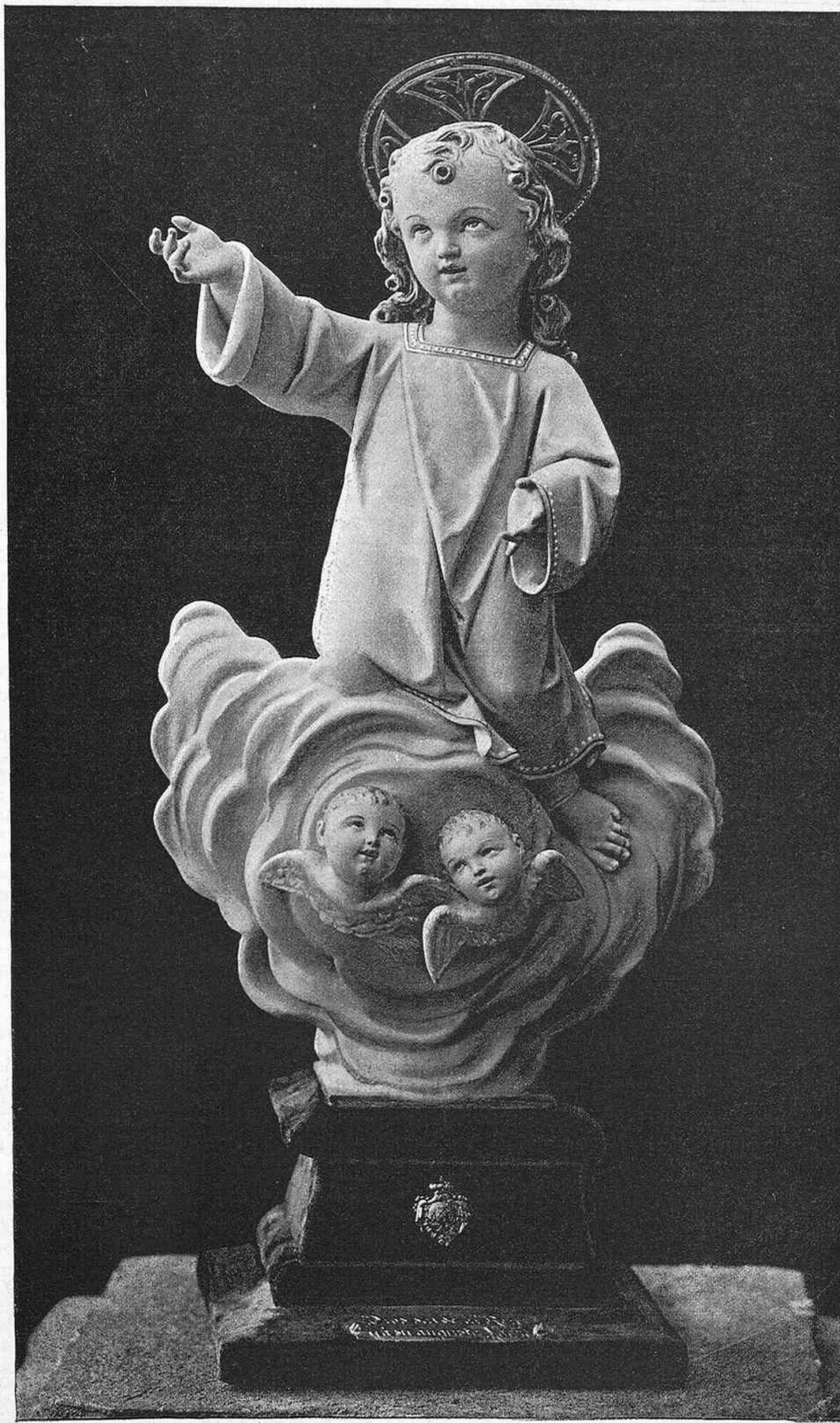
EL NIÑO JESUS, estatua tallada en madera por Pedro Barbará Presente del artista á S. M. la Reina Regente durante su estancia en Barcelona

— ¿No nota V. una falta? — ¡Ninguna! se apresuró á decir la niña. — Y sin embargo la hay, prosiguió el veterano. ¿No ve V. ahí sobre su corazón, una presilla? — Ah ¡sí! respondió Pura.