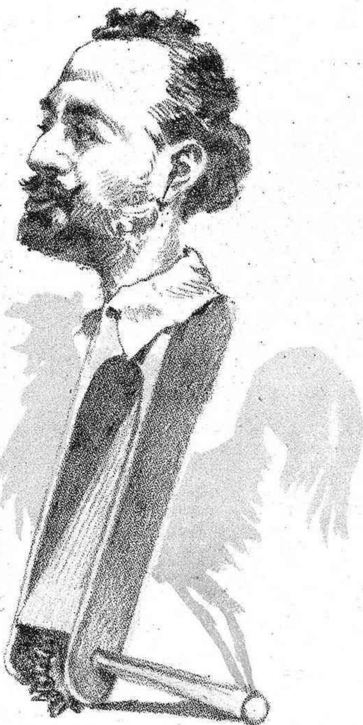
La carraca de Ste-año