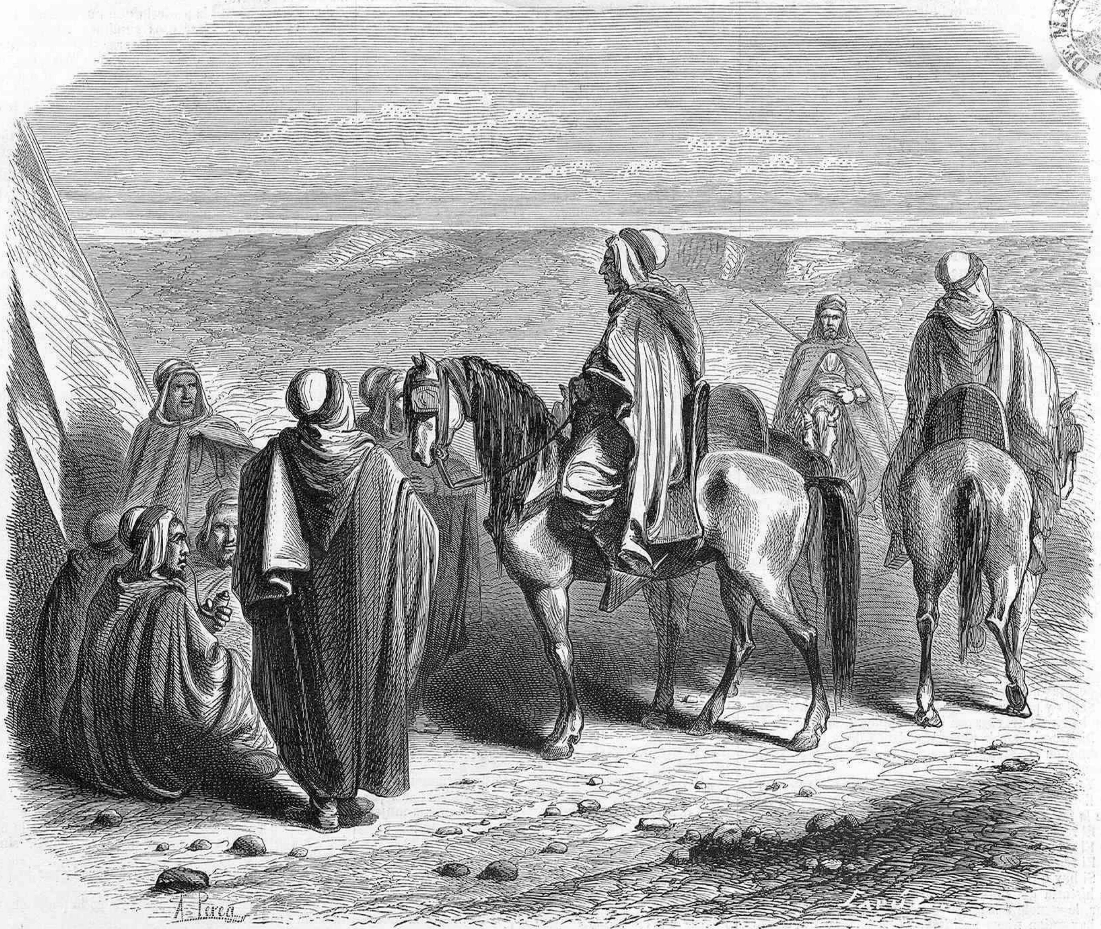
LOS SPAHIS DE LA GUARNICION DE PARIS.

El sol del recuerdo enseñoreándose magistrosamente del horizonte de la vida.