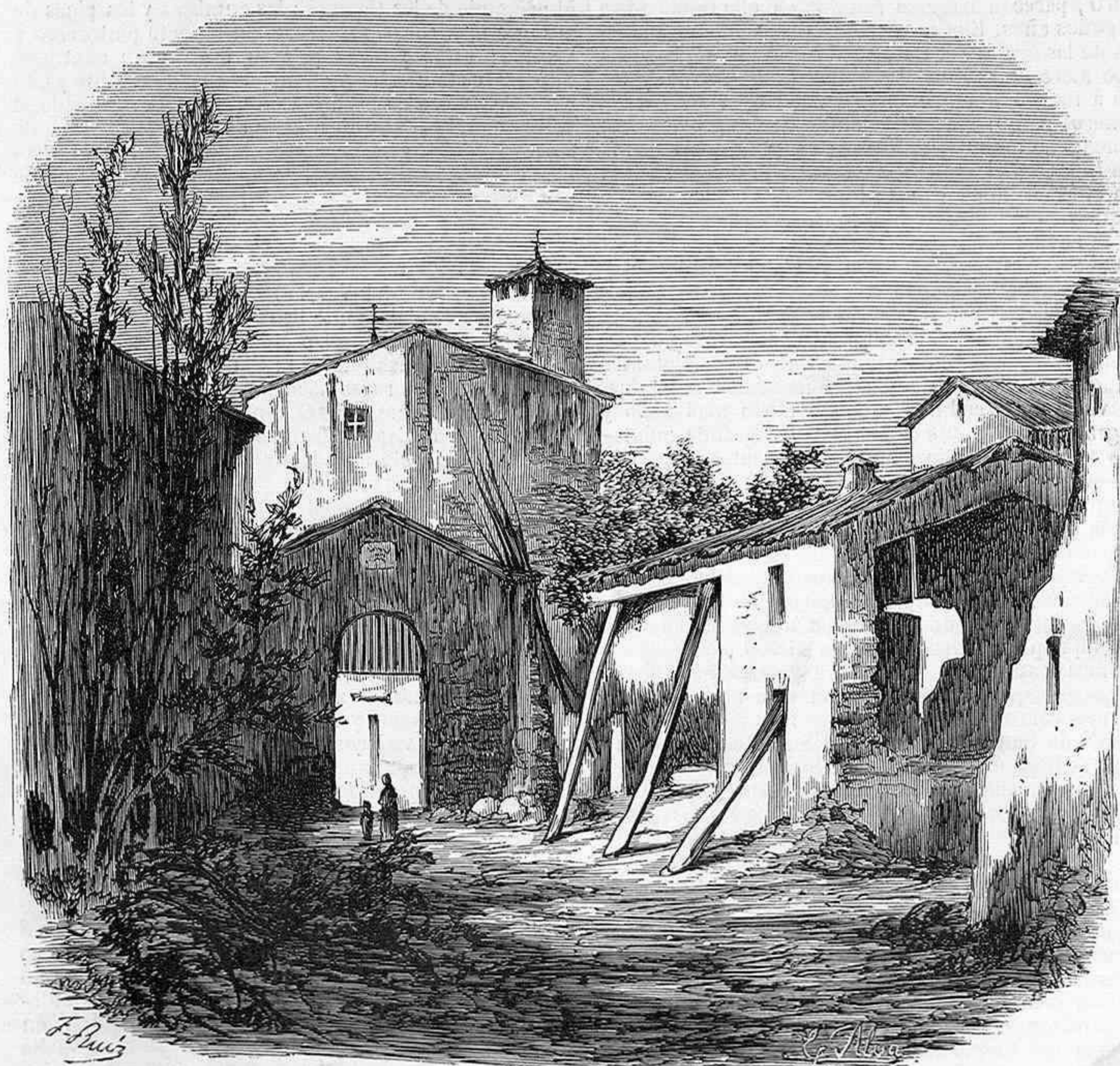
DESASTRES DE VICH.—PUERTA DE LAS TENERIAS, DIBUJO DEL SEÑOR PADRÓ.

Lector, el recuerdo es la huella de la existencia, el satélite de la humanidad.