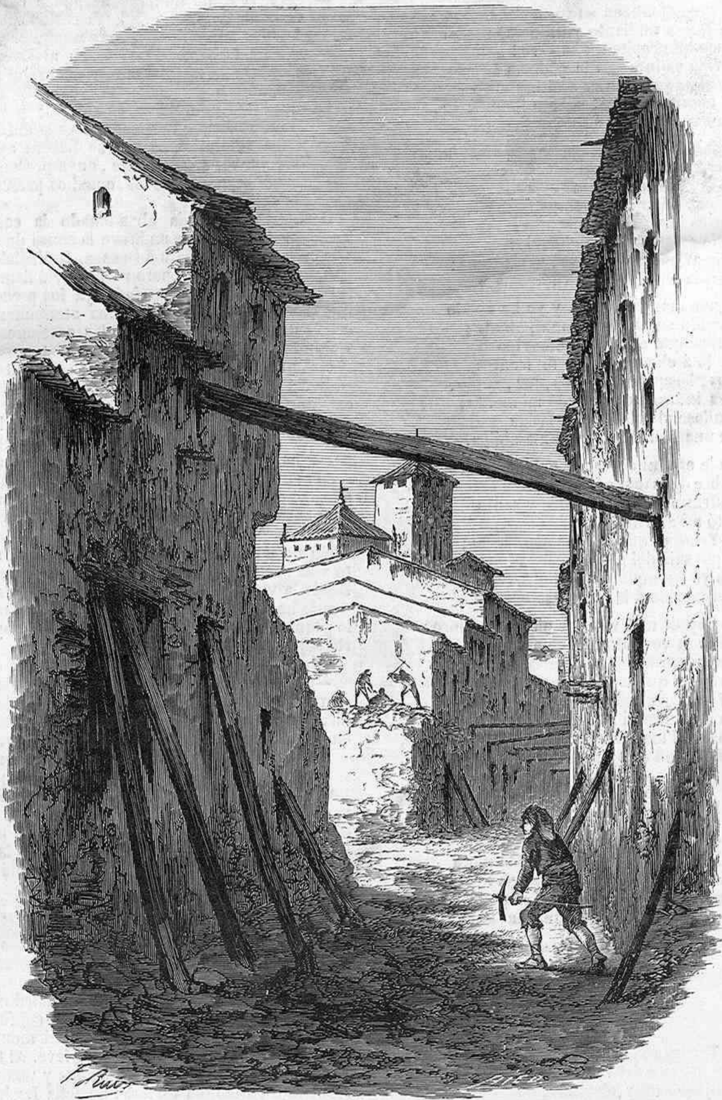
DESASTRES DE VICH.—DEMOLICIONES DE LA CALLE DE SAN FRANCISCO, DIBUJO DEL SEÑOR PADRÓ.

joyas que ya no necesita, y que pueden servirte en país extranjero. Hélas aquí. ¡Adios, adios, Dschellaledin!