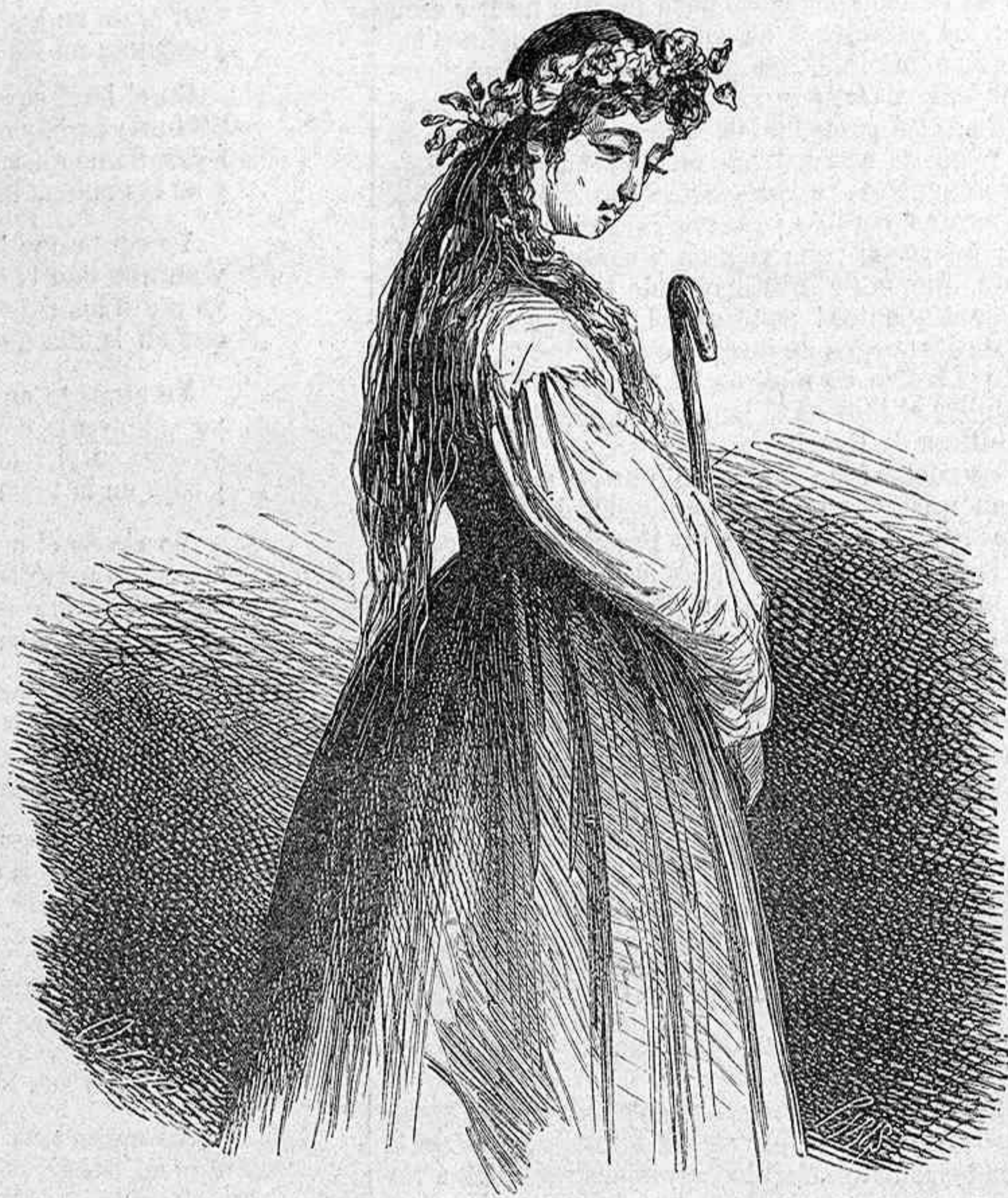
GALATEA.—OBRAS DE CERVANTES.