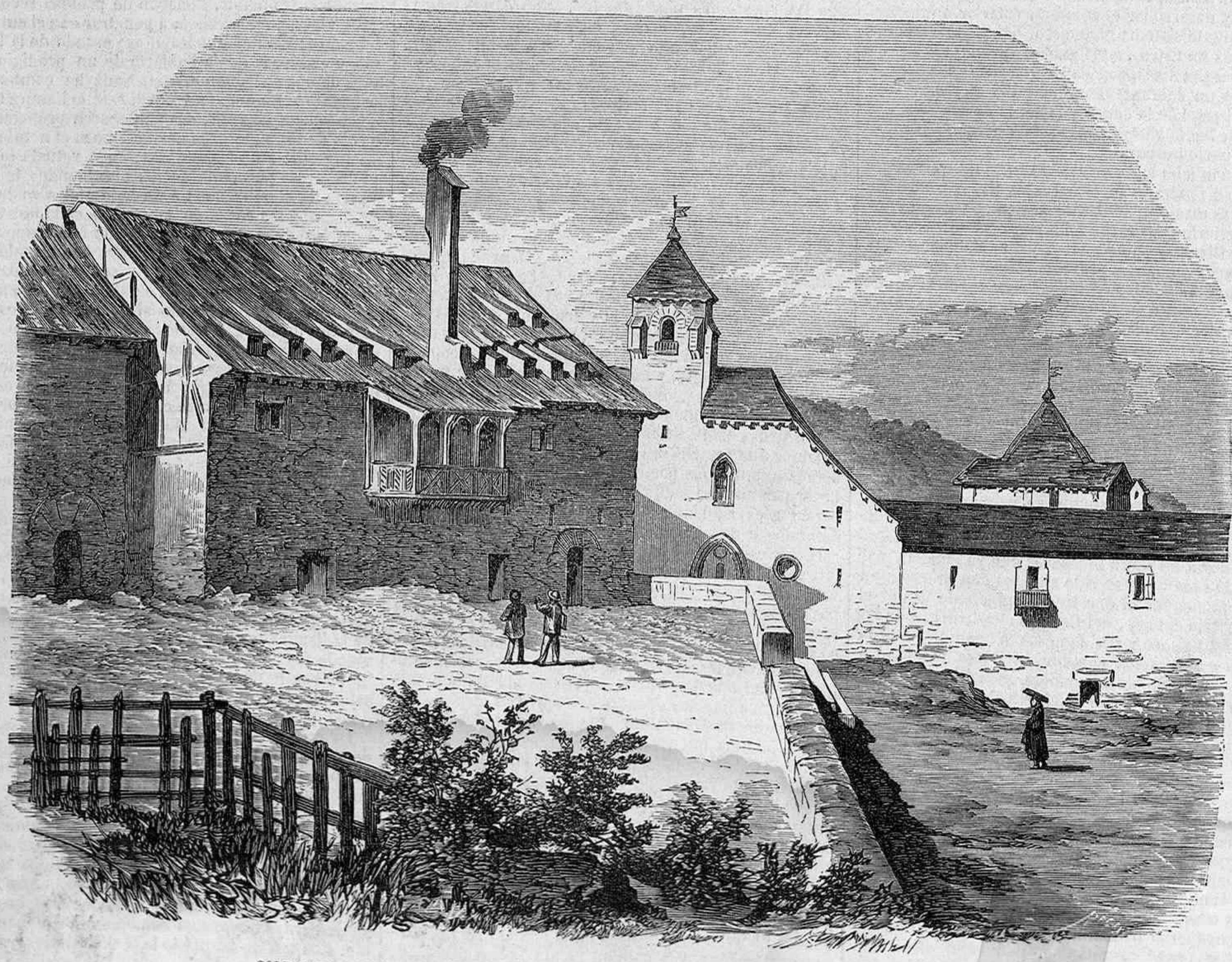
COLEGIATA DE NUESTRA SEÑORA DE RONCESVALLES, TOMADA DEL NATURAL. POR EL SEÑOR SERRA.

La sacristía, que es de construcción moderna, guarda algunas antigüedades y pinturas de verdadero mérito. Entre las primeras son notables varios efectos pertenecientes al pontifical del arzobispo de Reims, aquel famoso Turpin, por cuenta del cual Ariosto relató tantos