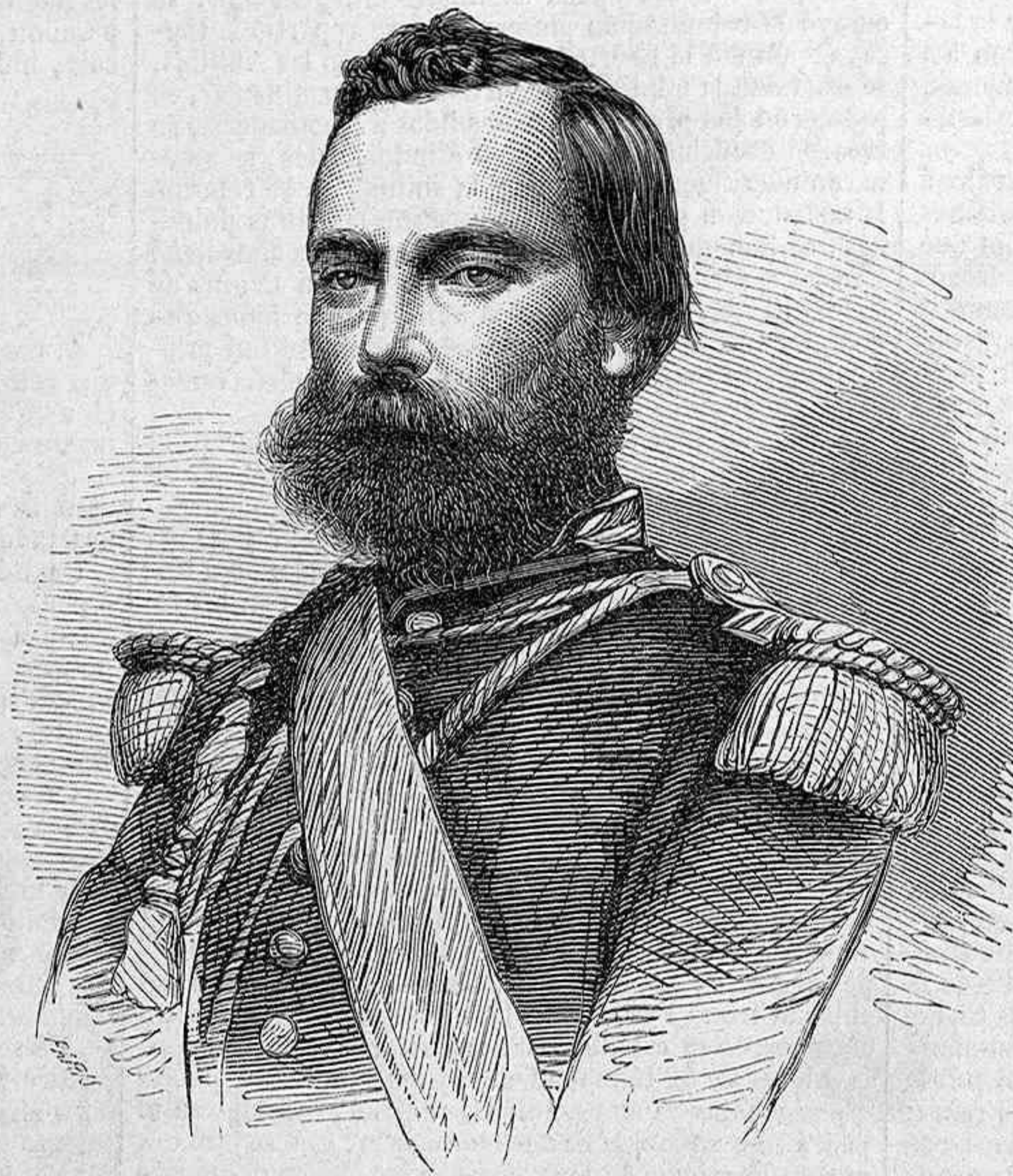
EL GENERAL PRADO, DICTADOR DEL PERÚ.

capilla, entre cuyas ruinas se encuentra, refiere la tradicion una de esas leyendas extraordinarias con que la piedad de nuestros padres se complacia en envolver el