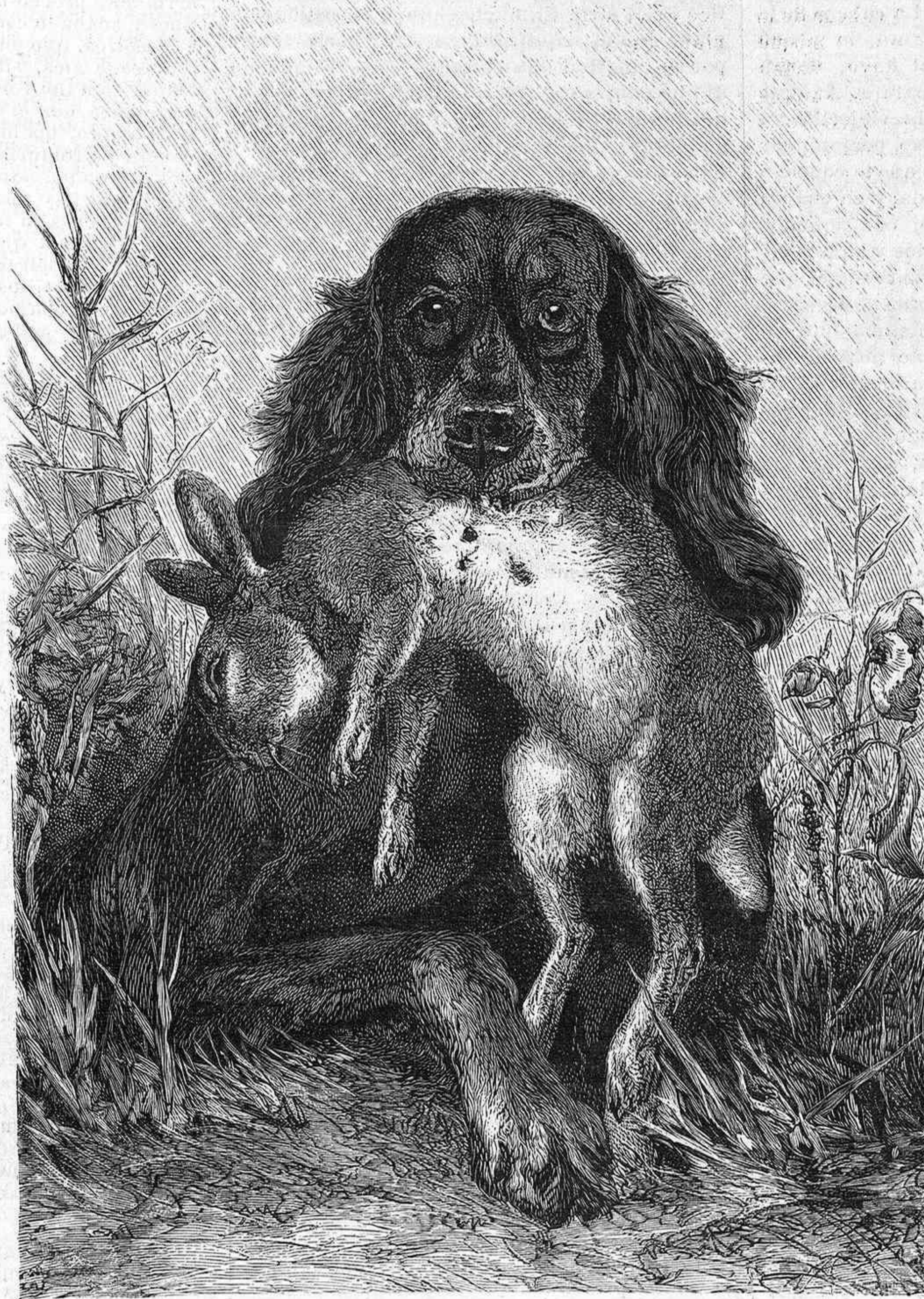
ESCENAS DE CAZA.—EL ÚLTIMO ESFUERZO.

Sin ser cosa del otro jueves, la composición hace bien; y si el cuadro en total no resiste la