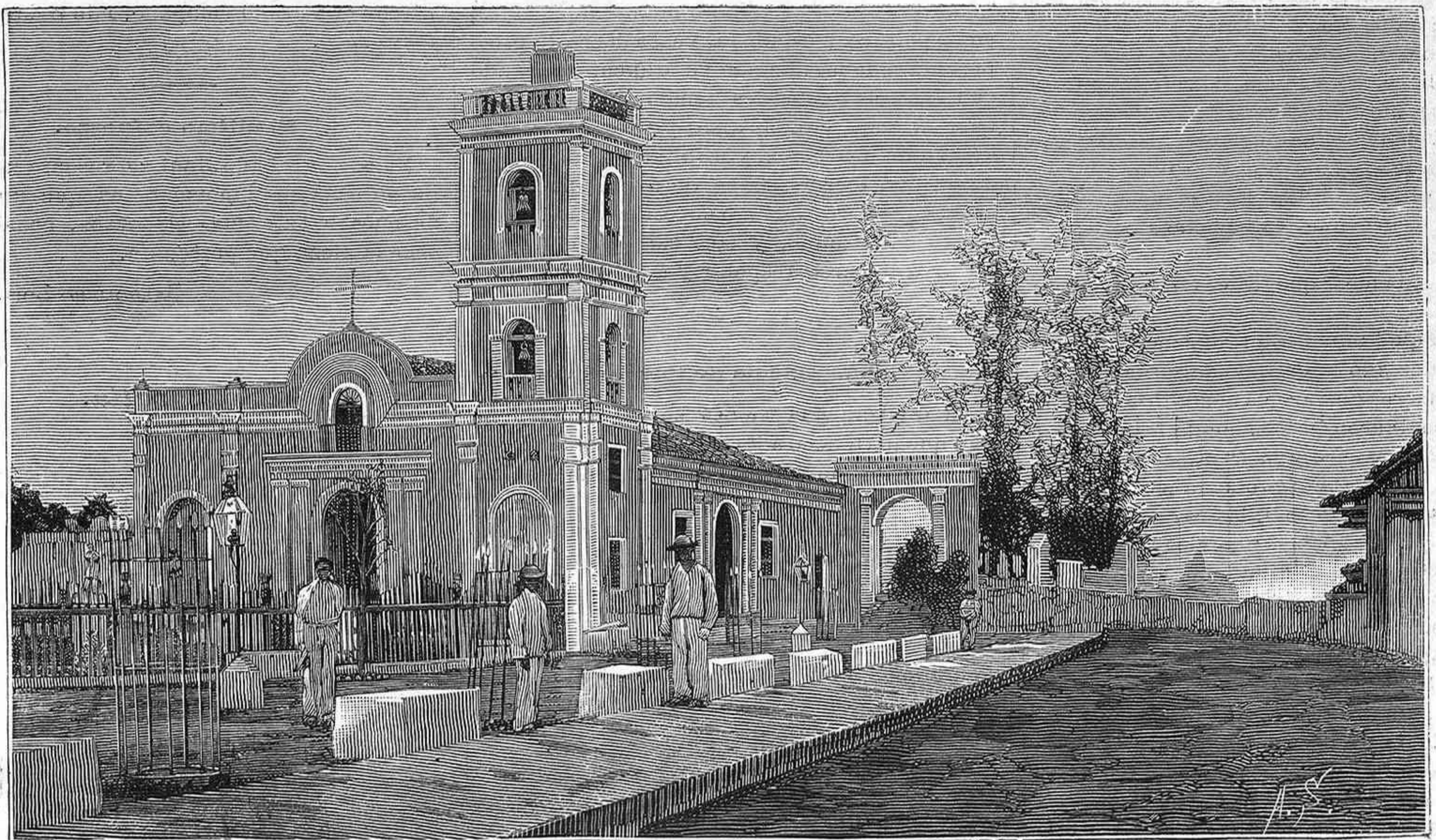
ISLA DE CUBA.—IGLESIA DE PUERTO PRÍNCIPE.