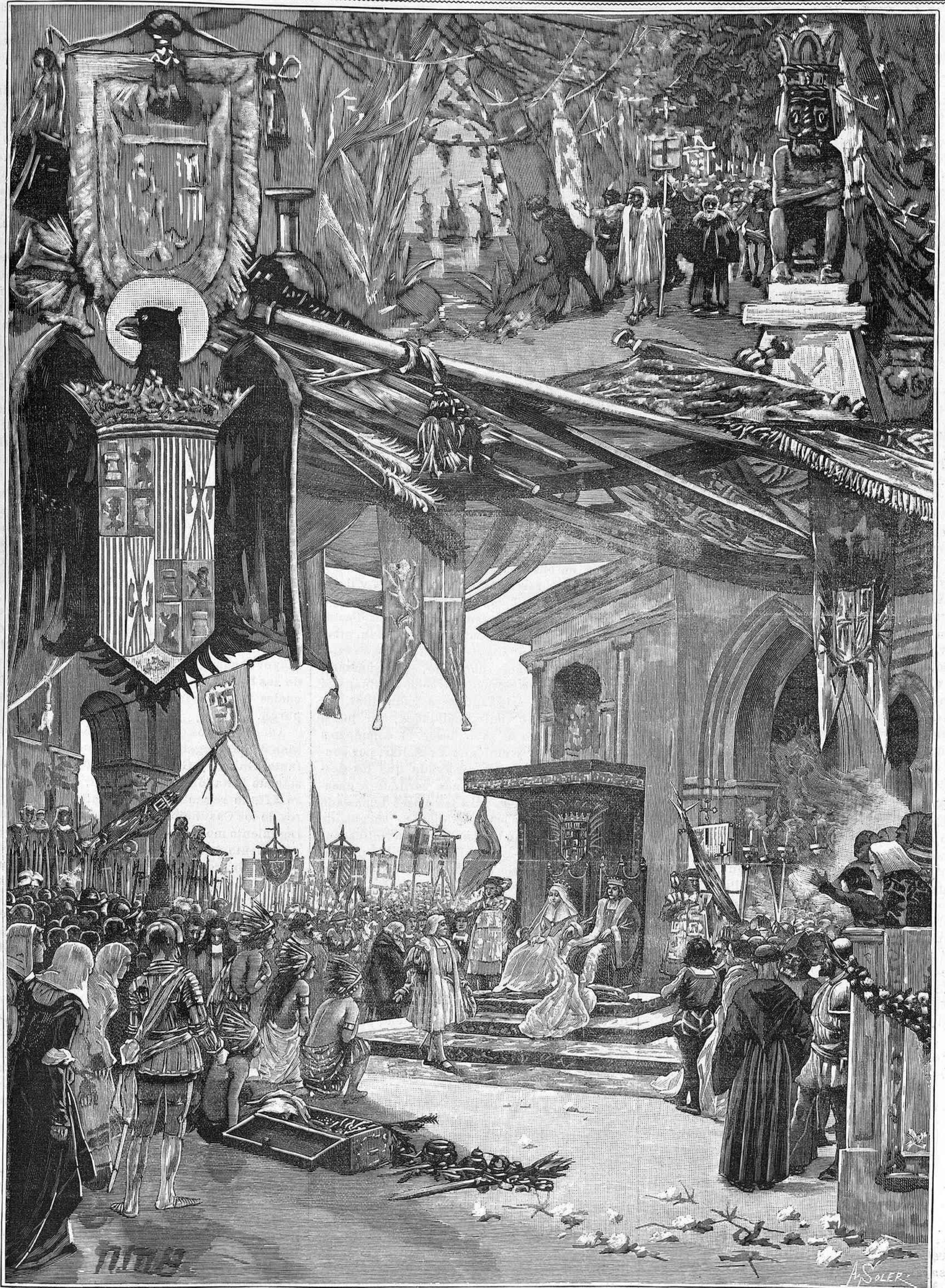
EL TEATRO ILUSTRADO.—ZARZUELA: Cristóbal Colón , ÓPERA EN TRES ACTOS DEL MAESTRO LLANOS.