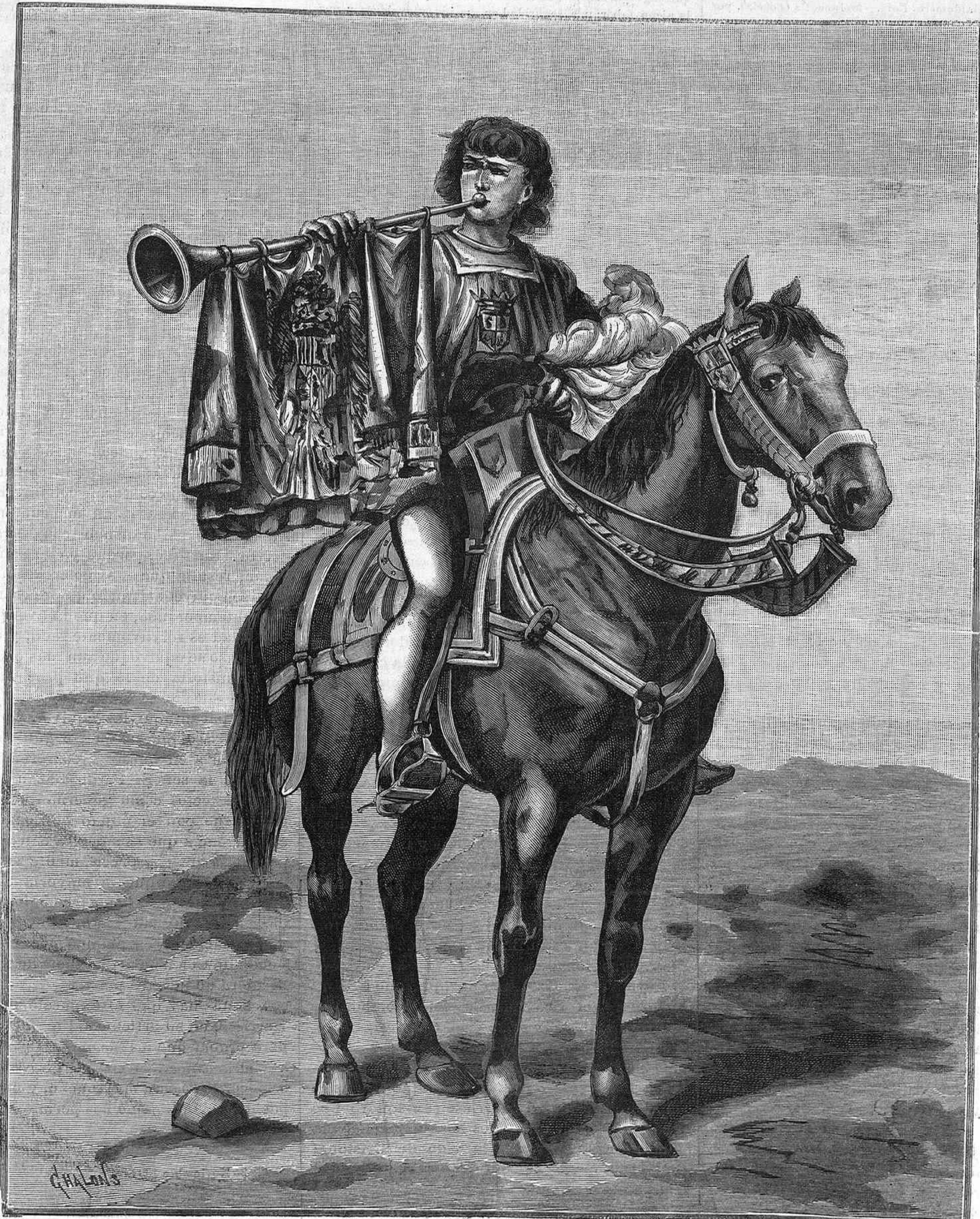
RECUERDOS DEL CENTENARIO.—LA CABALGATA HISTÓRICA DEL 13 DEL ACTUAL.—UN TROMPETERO. (Dibujo de Lagarde.)