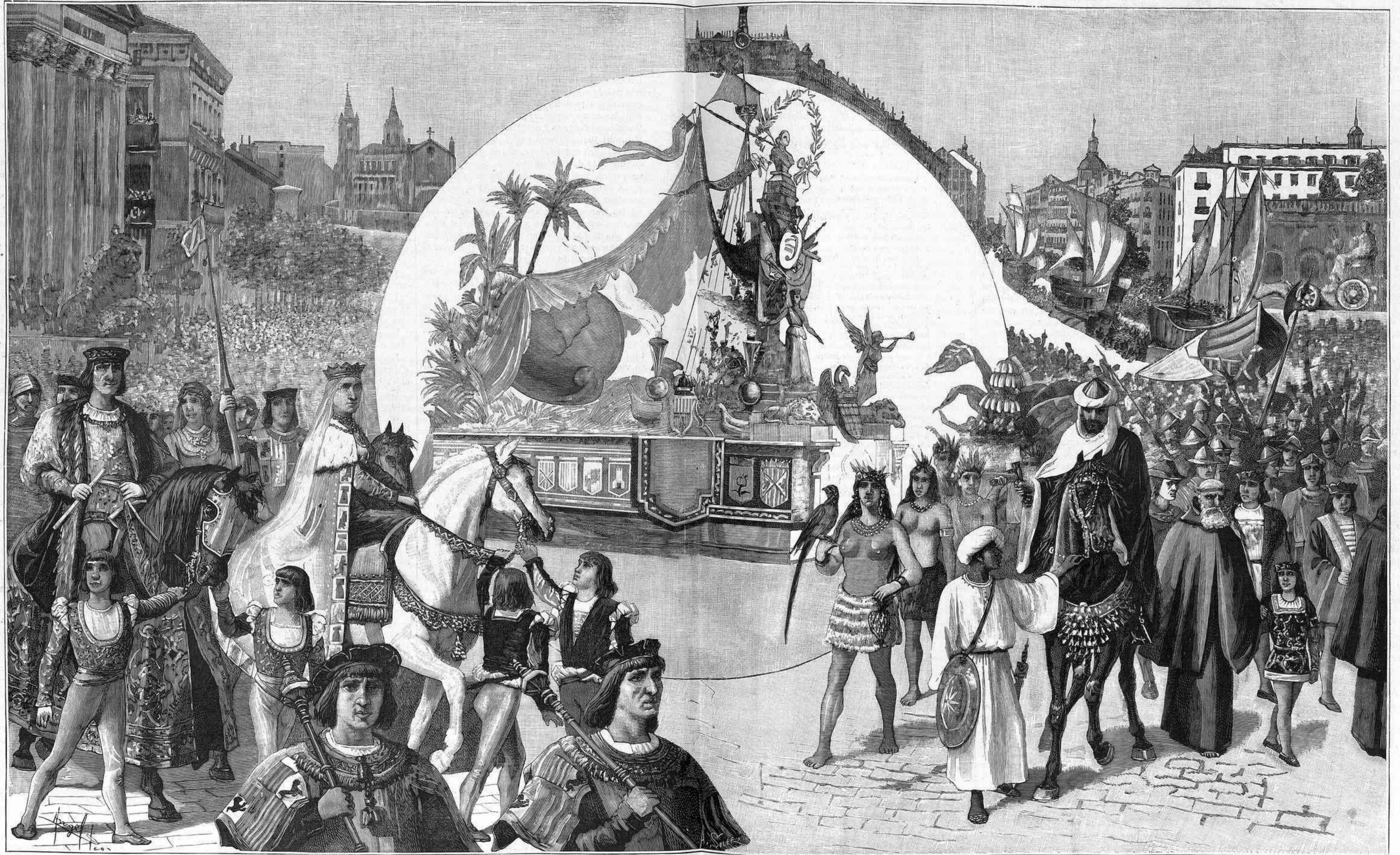
RECUERDOS DEL CENTENARIO.—LA GRAN CABALGATA HISTÓRICA DEL DOMINGO 13 DEL ACTUAL. (Apuntes del natural, por D. Manuel Angel.)