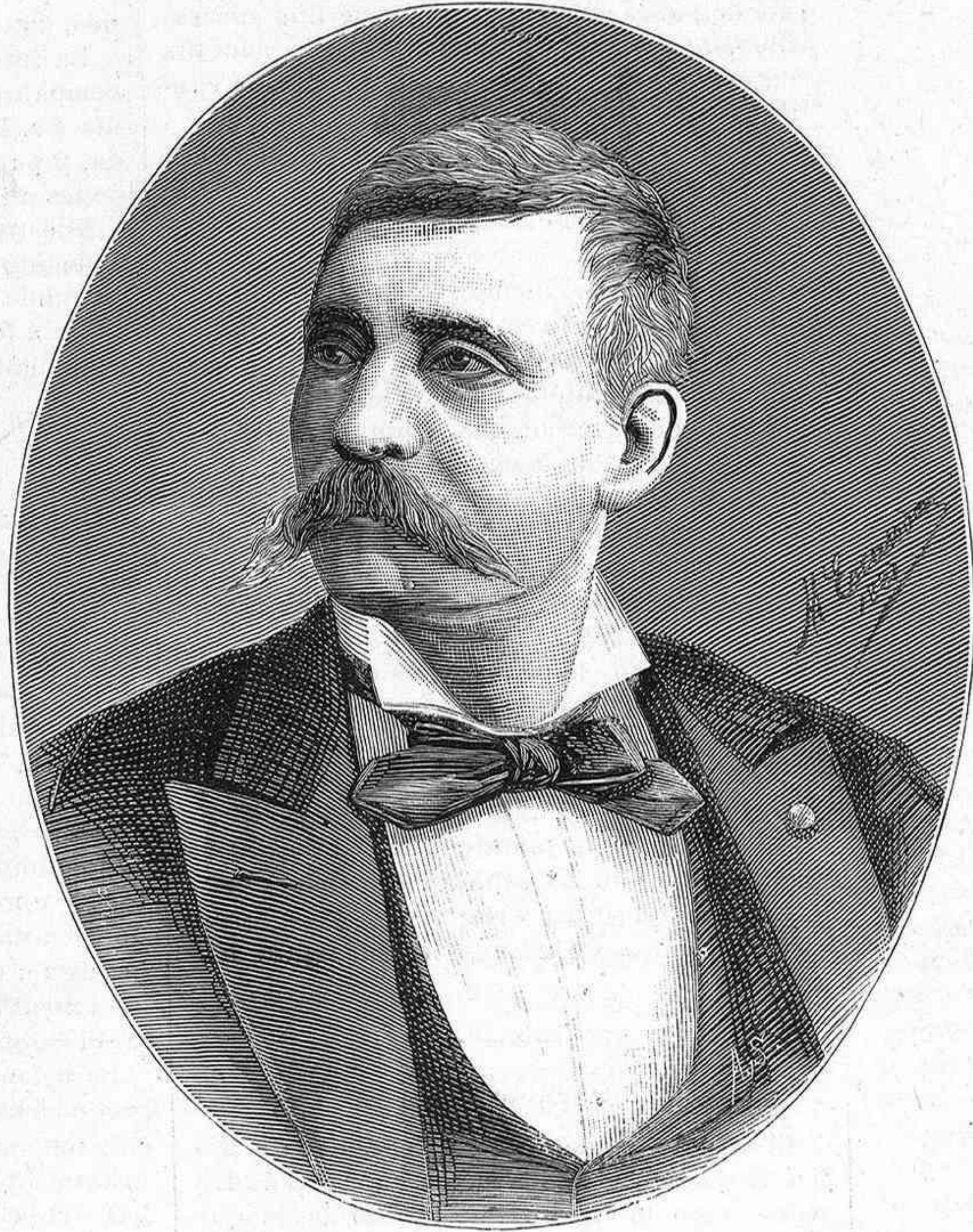
EL GENERAL D. PORFIRIO DÍAZ, PRESIDENTE DE LA REPÚBLICA MEXICANA.