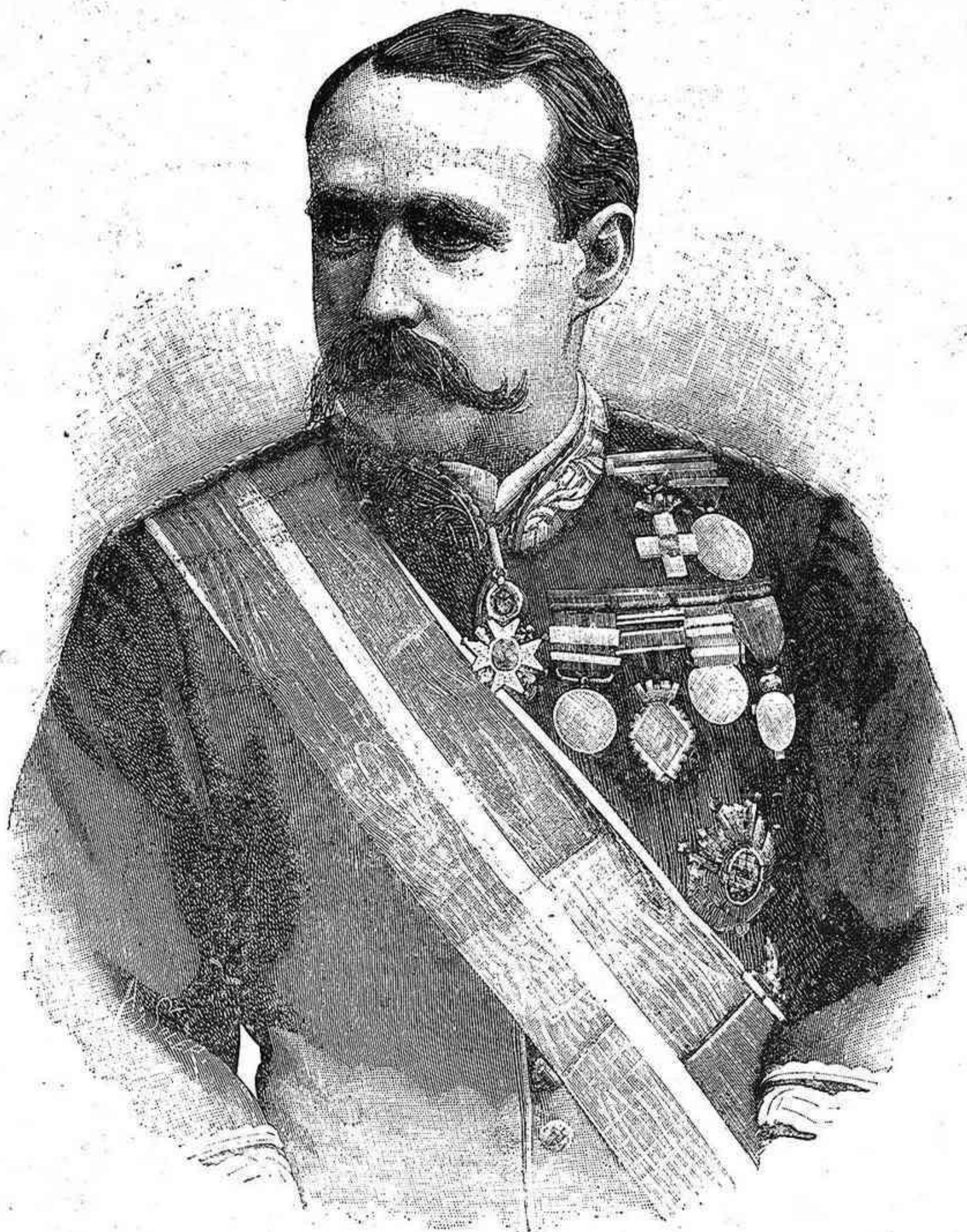
EXCMO. SR. TENIENTE GENERAL D. CAMILO POLAVIEJA MINISTRO DE LA GUERRA

Tal sería, según se nos alcanza á nosotros, la única forma de gobierno que no se ha ensayado todavía en España: el gobierno del país por sí mismo. Para el éxito de su programa regenerador y patrióti-