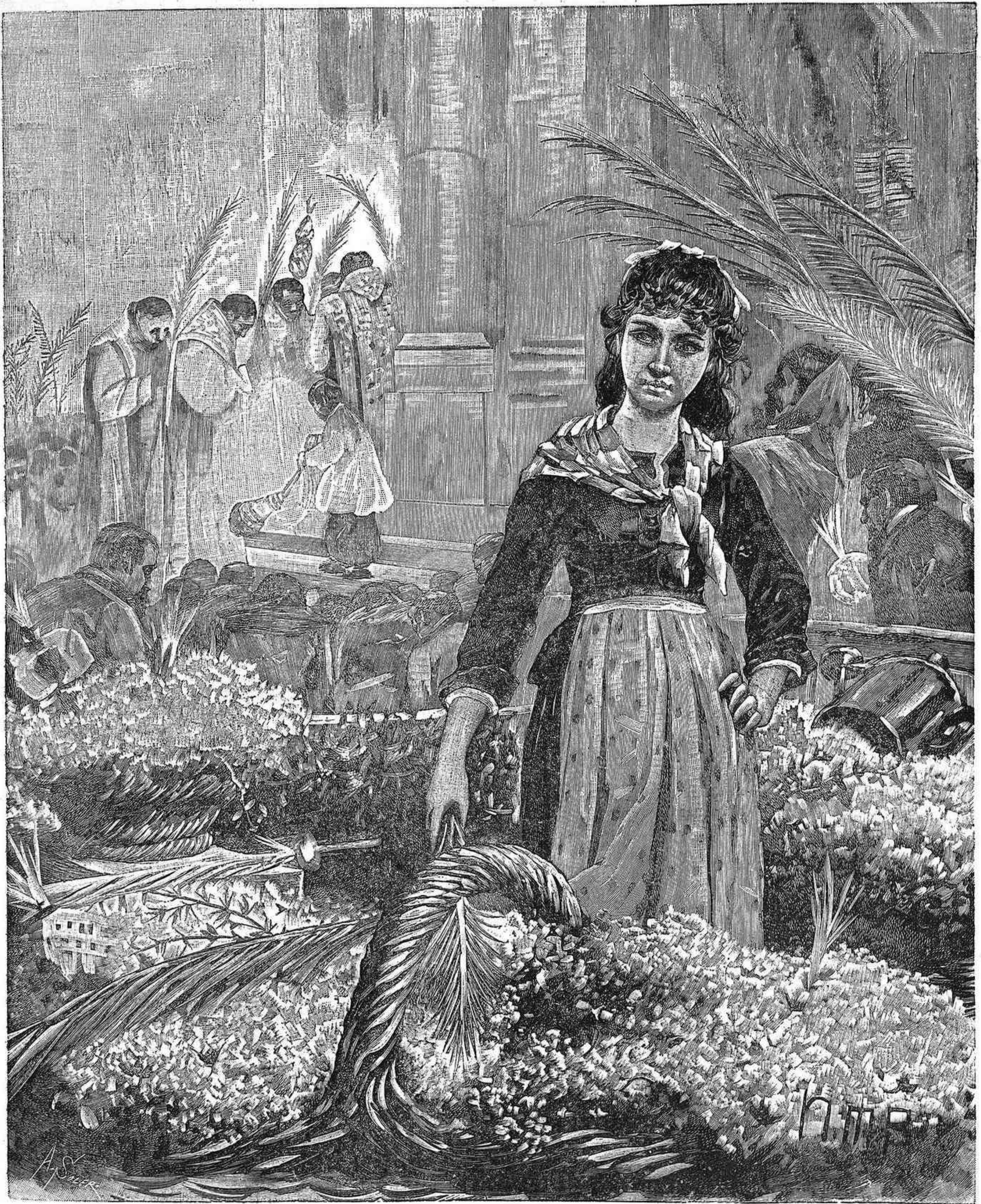
DOMINGO DE RAMOS