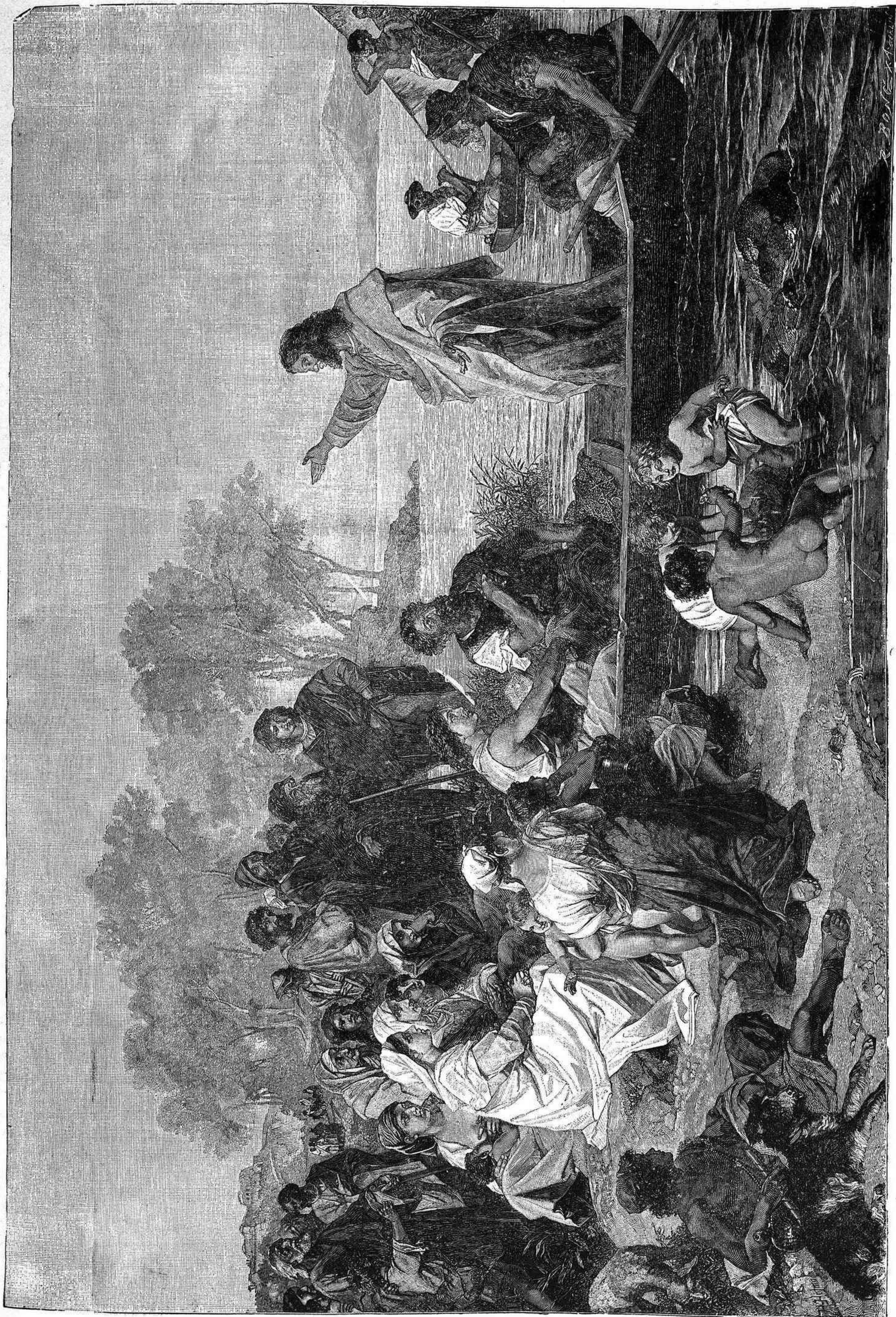
JESUCRISTO EN EL LAGO DE TIBERIADES