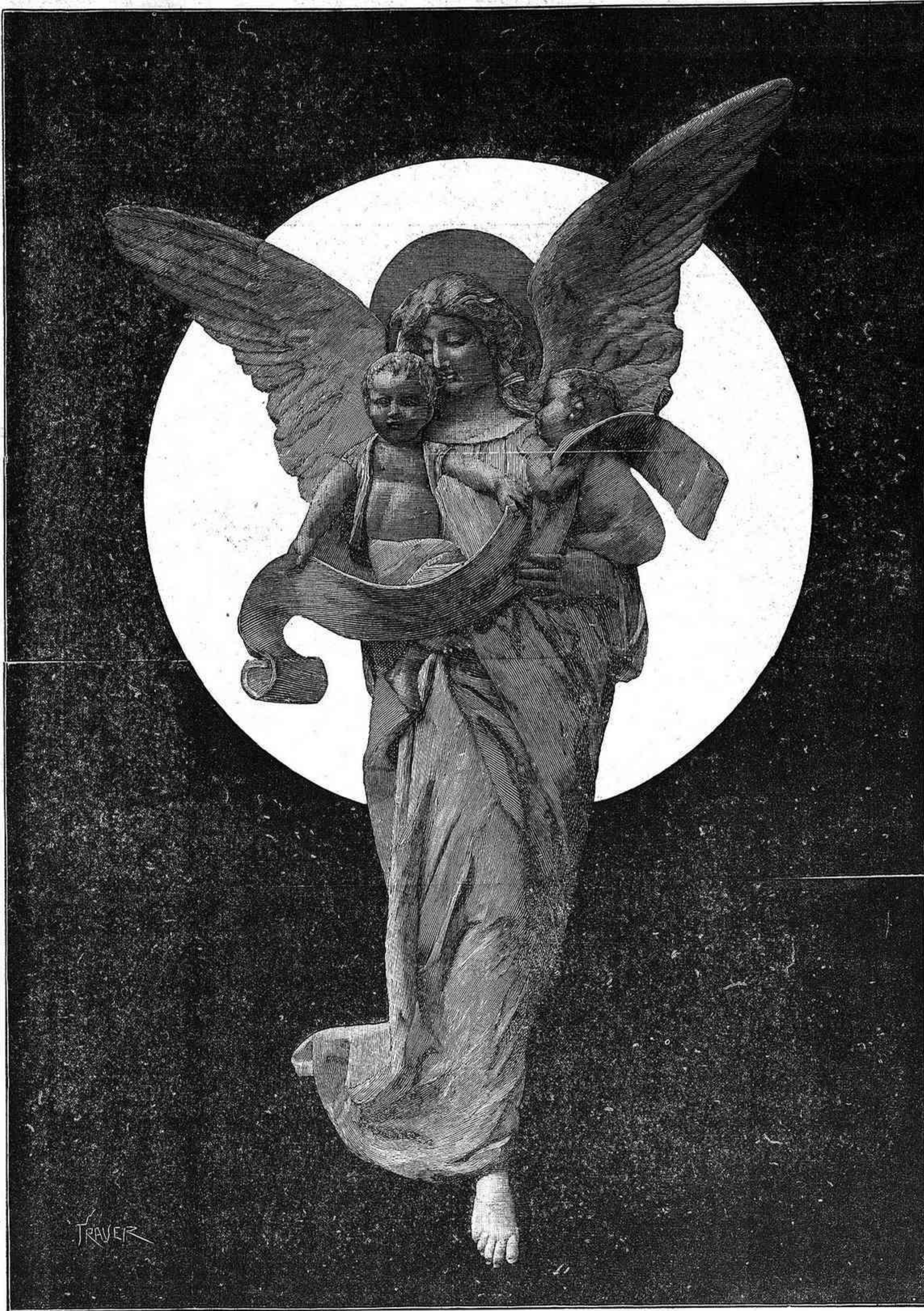
LA CARIDAD. — BAJO RELIEVE DEL MONUMENTO FRIGIDO AL MARQUÉS DE VALLEJO, EN EL COLEGIO DE GUARDIAS JÓVENES DE VALDEMORO ( Proyecto y ejecución de Alsina ).

en cuatro grandes frescos. La Filosofía, ó escuela de Atenas, la segunda en el orden dentro del salón, y la primera por su mérito, es una admirable composición, en la cual, bajo la forma de los más grandes labios de la antigüedad, agrupados en una especie de gimnasio ó templo, Rafael retrató algunos personajes célebres de su tiempo.