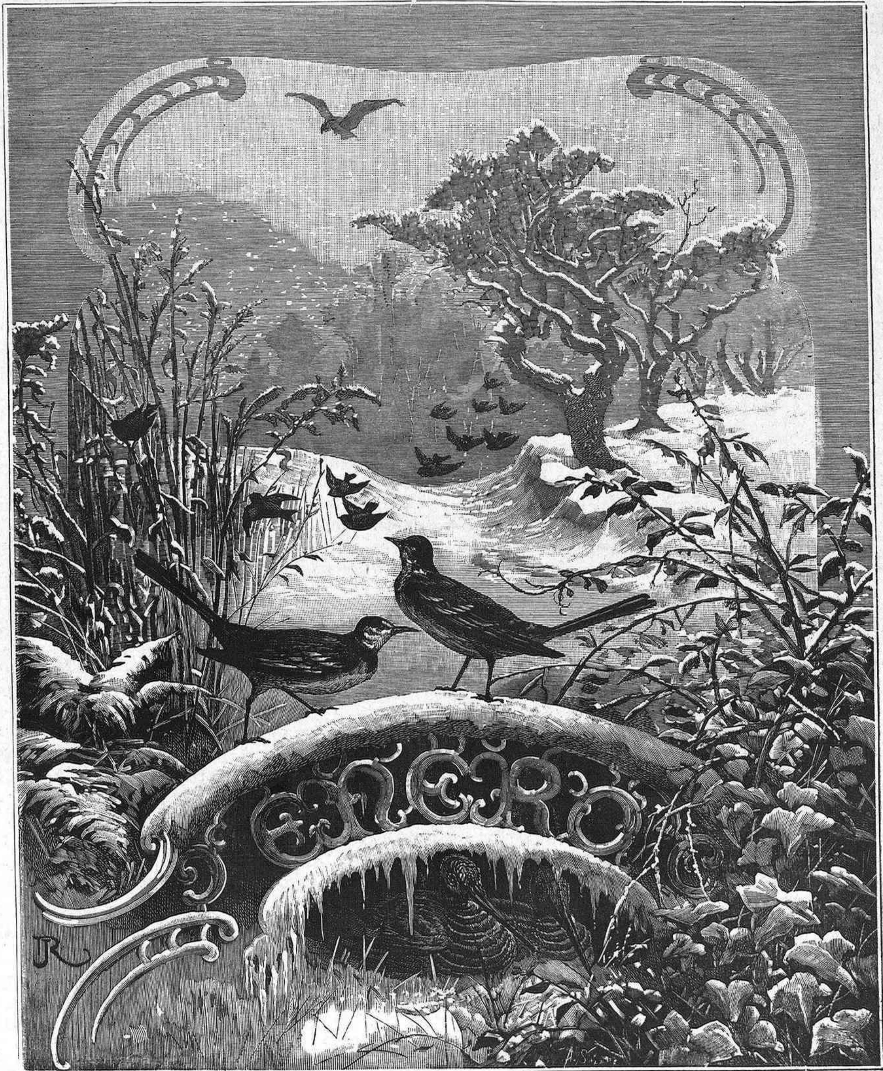
ALEGORÍA DEL MES DE ENERO