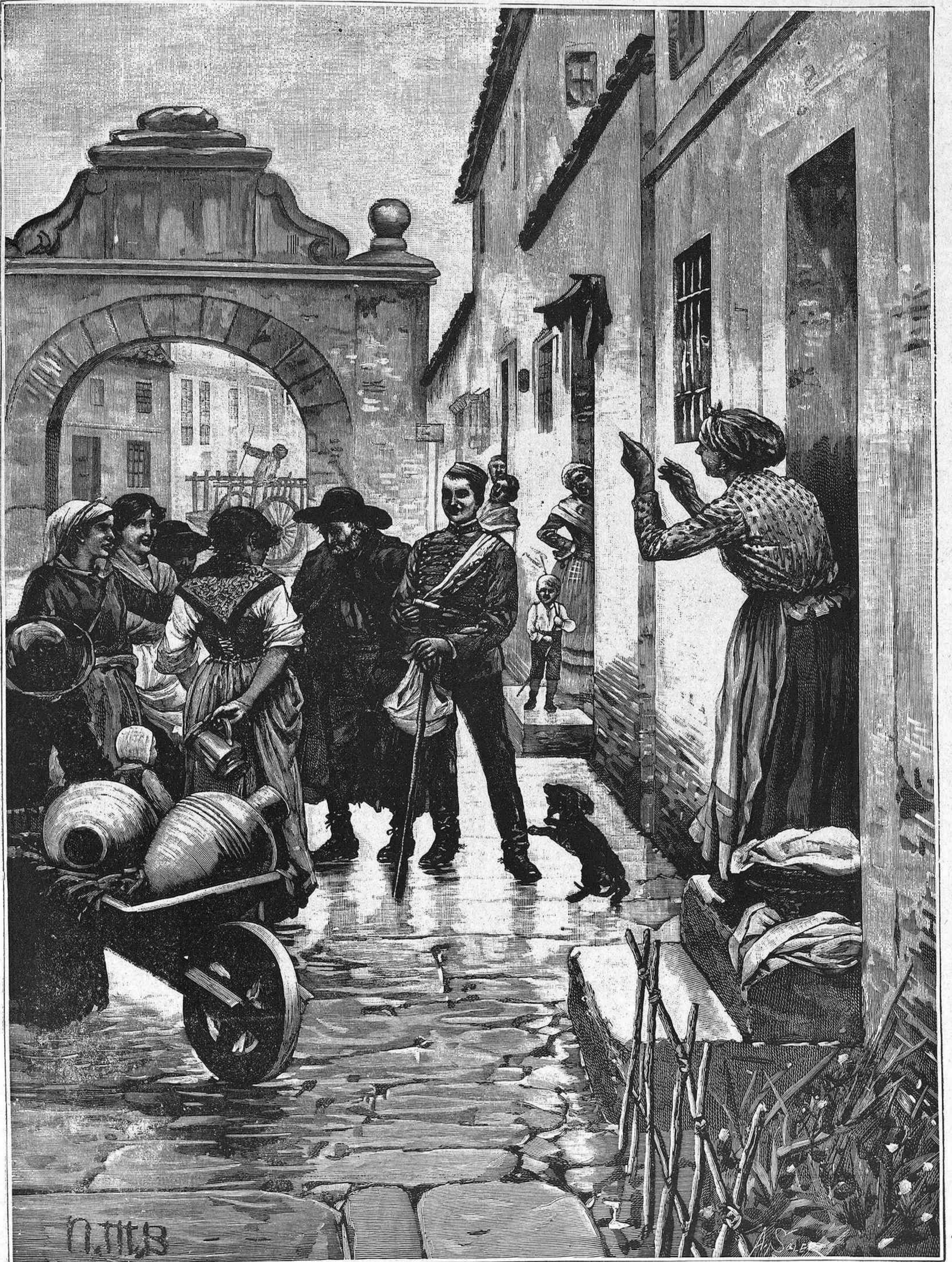
LA VUELTA DEL SOLDADO (D. Jujo de Méndez Bringa.)