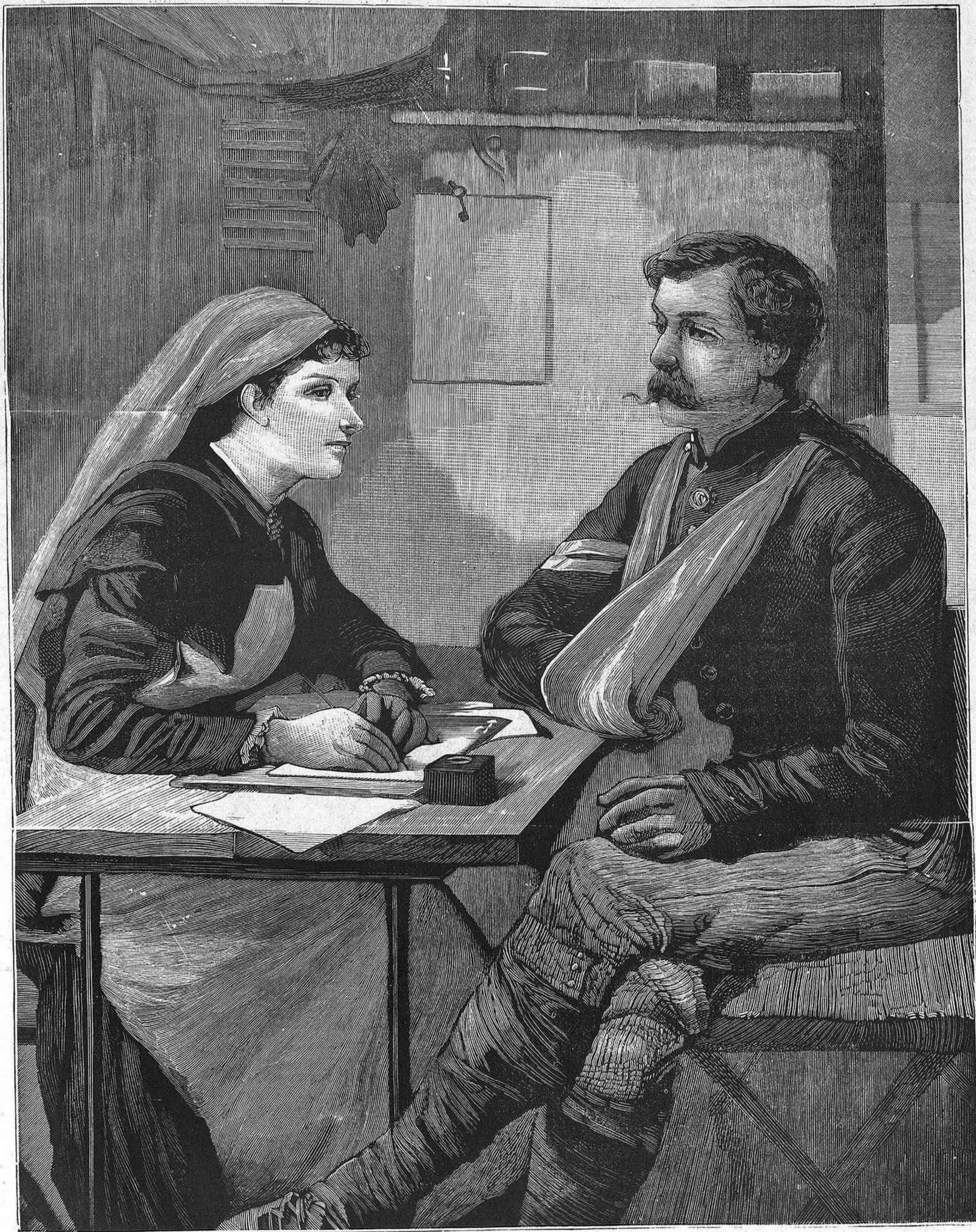
GUERRA ANGLO BOER.— UN HERIDO.