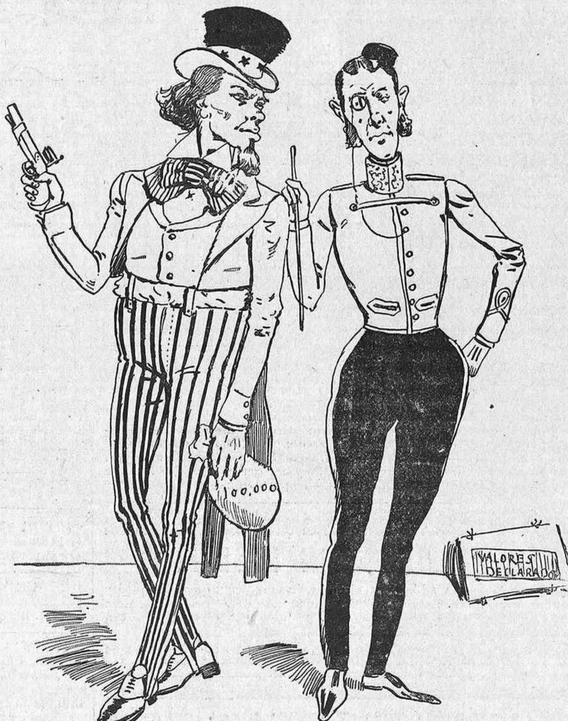
En la ocasión presente, el tío Sam no está dispuesto á dejarse convencer por Jhon Bull.

Arte de la lectura se vende al precio de tres pesetas en las principales librerías, y en la Administración de El Magisterio Español , Reina 8, Madrid.