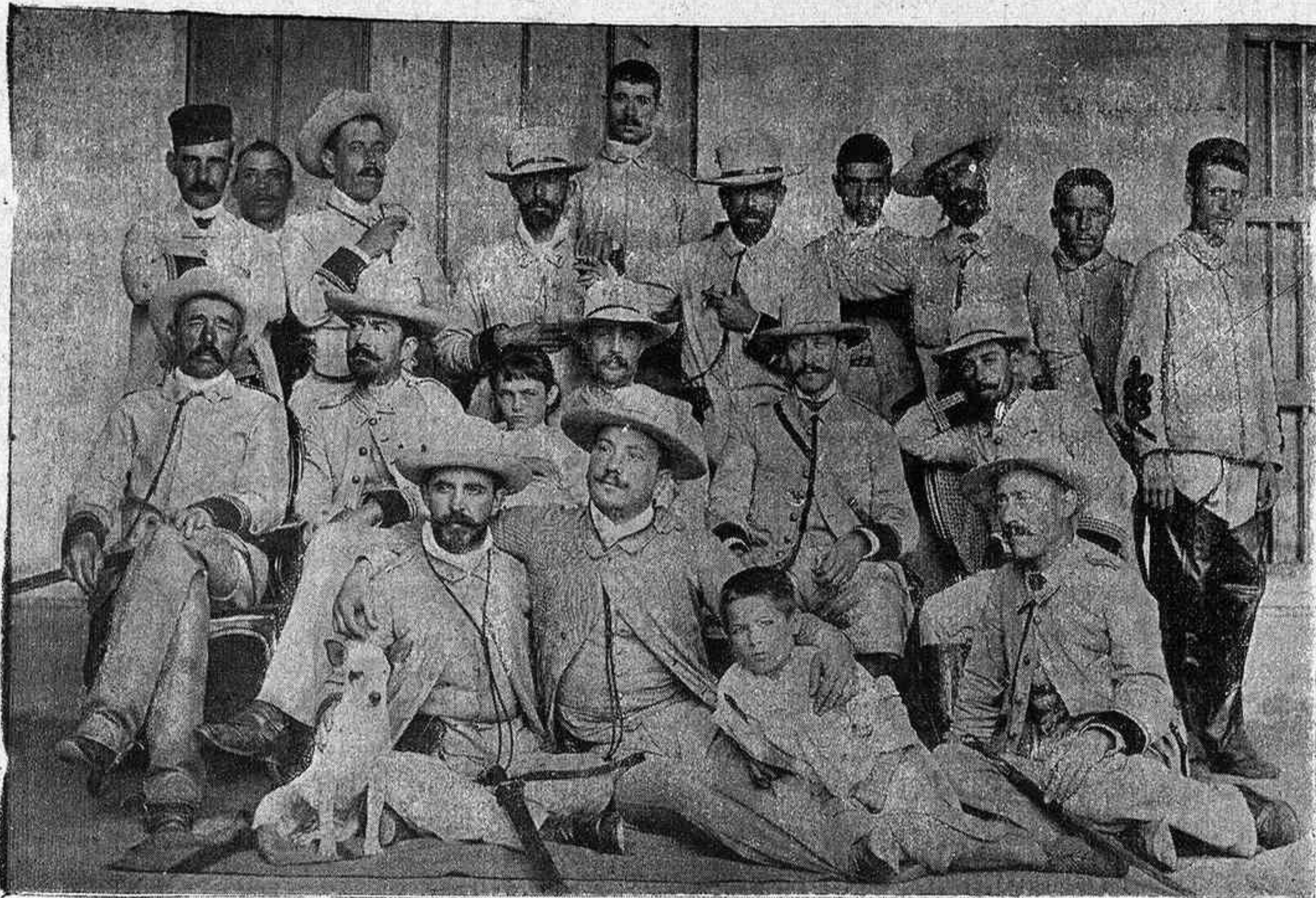
ISLA DE CUBA.—Grupo de oficiales del batallón de San Quintín.