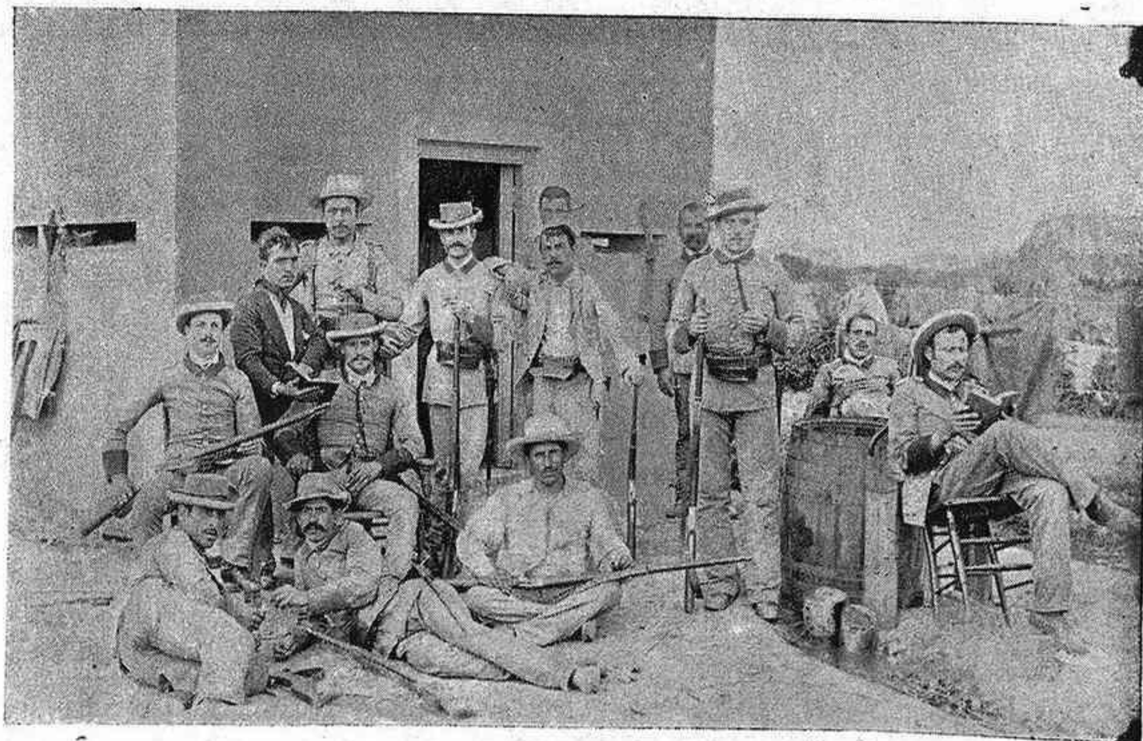
ISLA DE CUBA.—Grupo de la fuerza de la Guardia civil que hizo la defensa de Hoyo Colorado.

Artemisa está convertido hoy en un verdadero campamento, y sus moradores disfrutan de la tranquilidad que les garantiza la vigilancia del general Arolas y el valor de nuestros soldados.