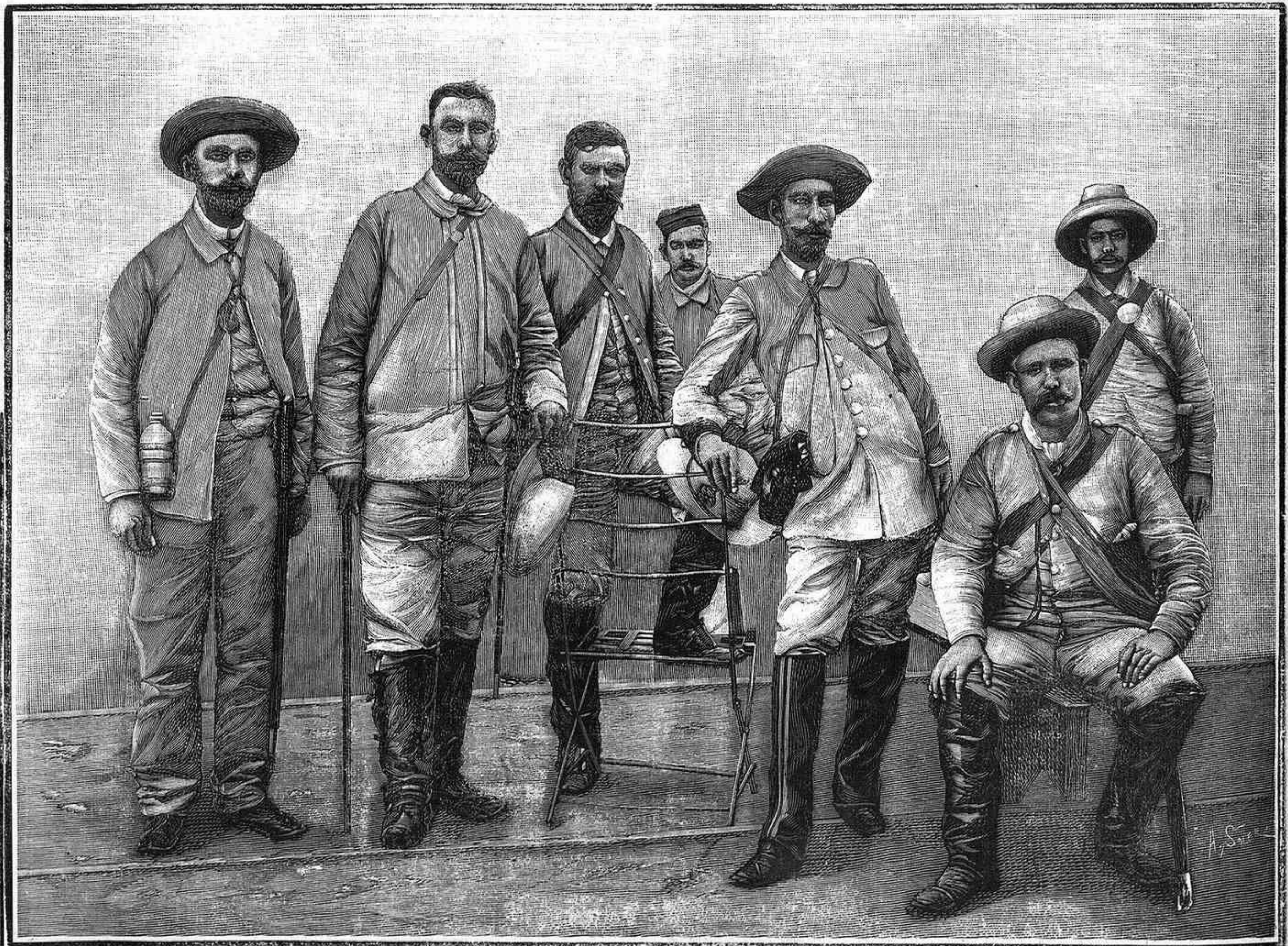
Grupo de oficiales del escuadrón de Treviño, después de la acción de Mamey.