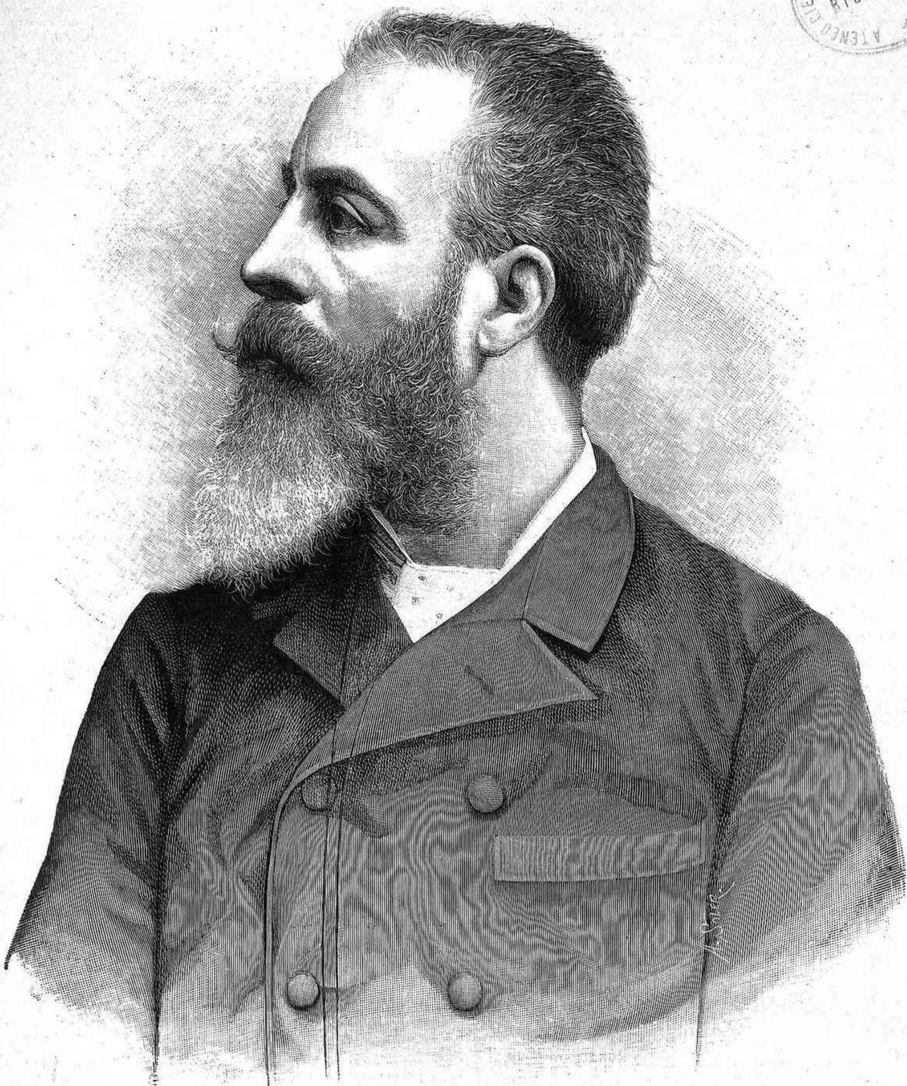
Excmo. Sr. D. Alejandro Pidal y Mon, presidente del Congreso.