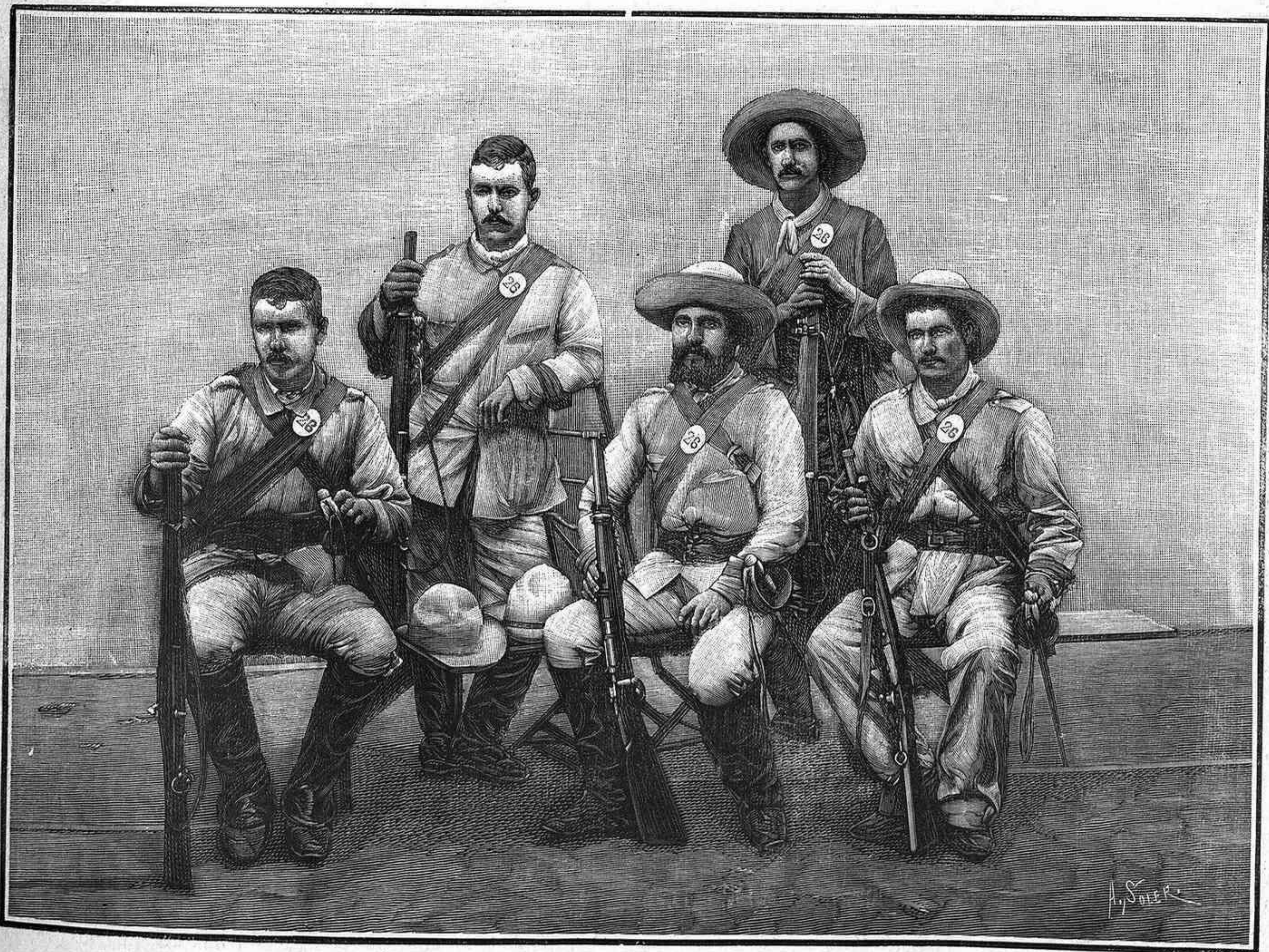
Grupo de sargentos del escuadrón de Treviño, después de la acción de Mamey.

Realiza nuestra marina militar un hecho que á todos nos regocija: apresa un cañonero en la costa Norte de Pinar del Río, una goleta filibustera (la Competitor ), caen en poder de [nuestros bravos marinos algunos de los piratas que la tripulaban; y cuando con perfecto derecho nuestros Tribunales de guerra les juzgan y sentencian, el Gobierno norteamericano se interpone, é invocando un tratado que en un caso como el presente no puede ni debe tener valor legal, se opone á que la sentencia se ejecute, por haberlo