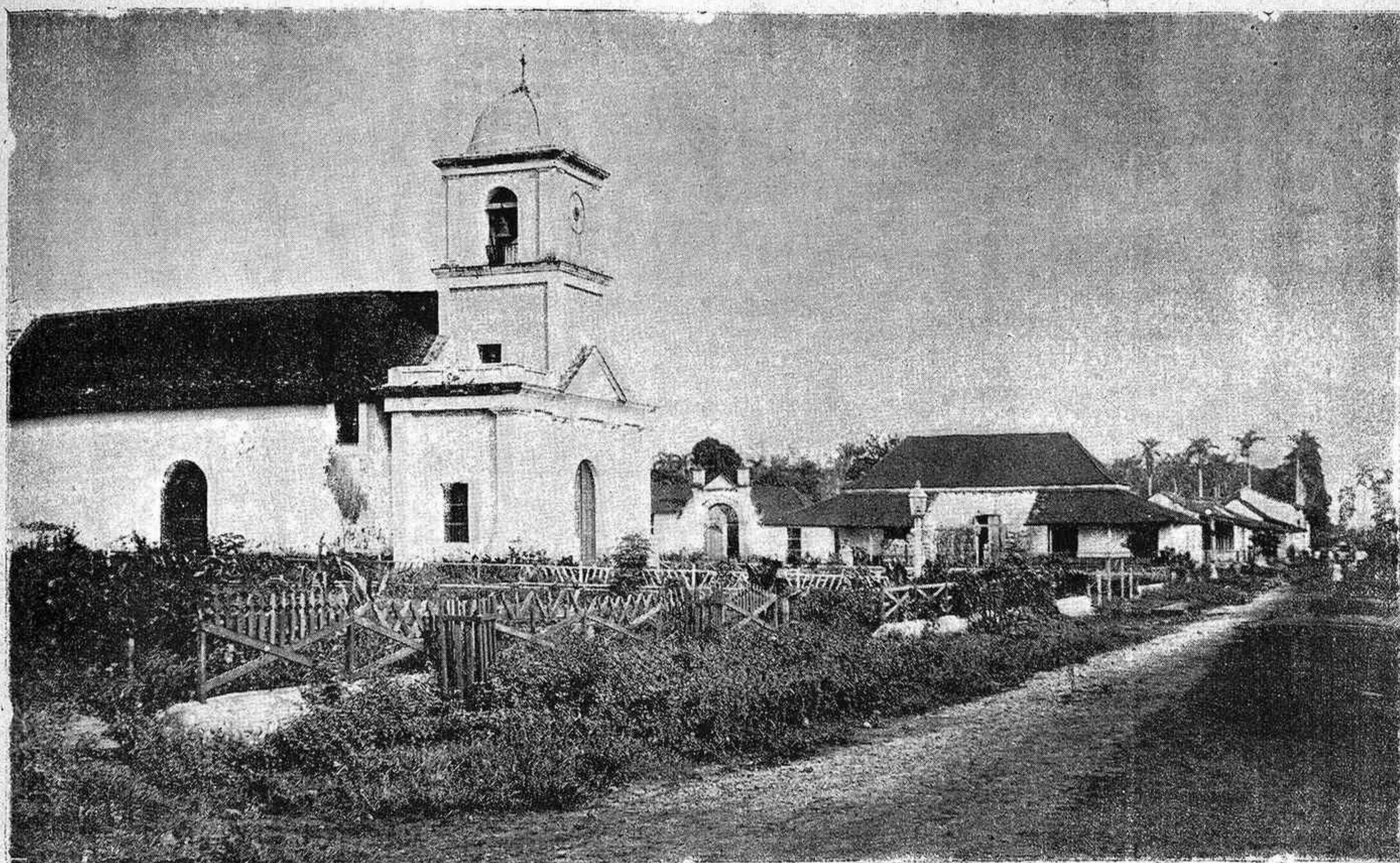
ISLA DE CUBA.—Artemisa: Iglesia, plaza y calle Real.

Los primeros azulejos consisten, por lo tanto, en pequeñas piezas (blancas y azules) de distintas formas, no hechas á molde, sino cortadas á pico de lozas grandes y con las que los mahometanos solían imitar el mosaico que los romanos labra-