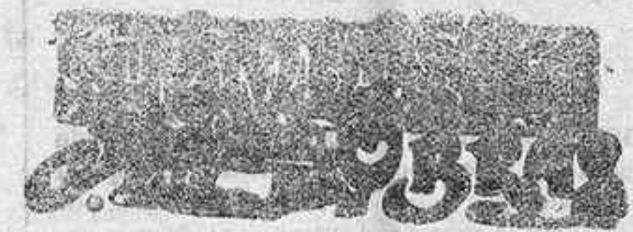
LA EMPERATRIZ JOSEFINA

Ha empezado algún movimiento de toneles ó bocoyes vacíos, usados, con destino á los diversos departamentos vinícolas franceses.