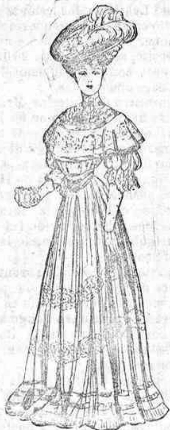
Troje para reuniones

De seda ó batista, con multitud de aplicaciones de bordado que matizan el cuello, cuerpo y falda. Manga corta con volante de encaje. Cinturón de tres órdenes con bonitos broches en el delantero y falda á pliegues con tres volantes en su extremo.