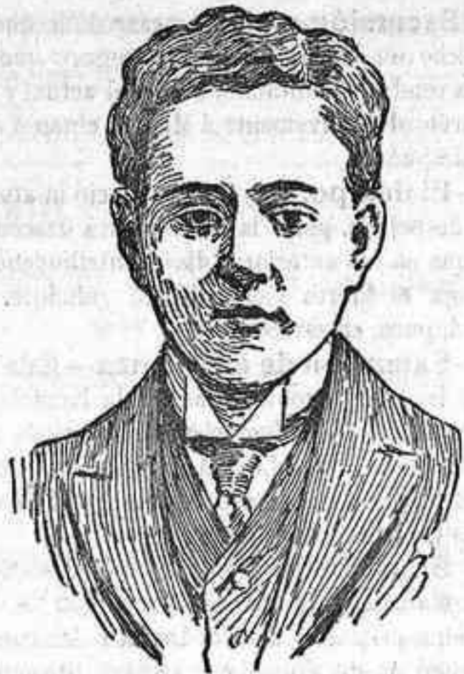
D. Manuel II de Portugal