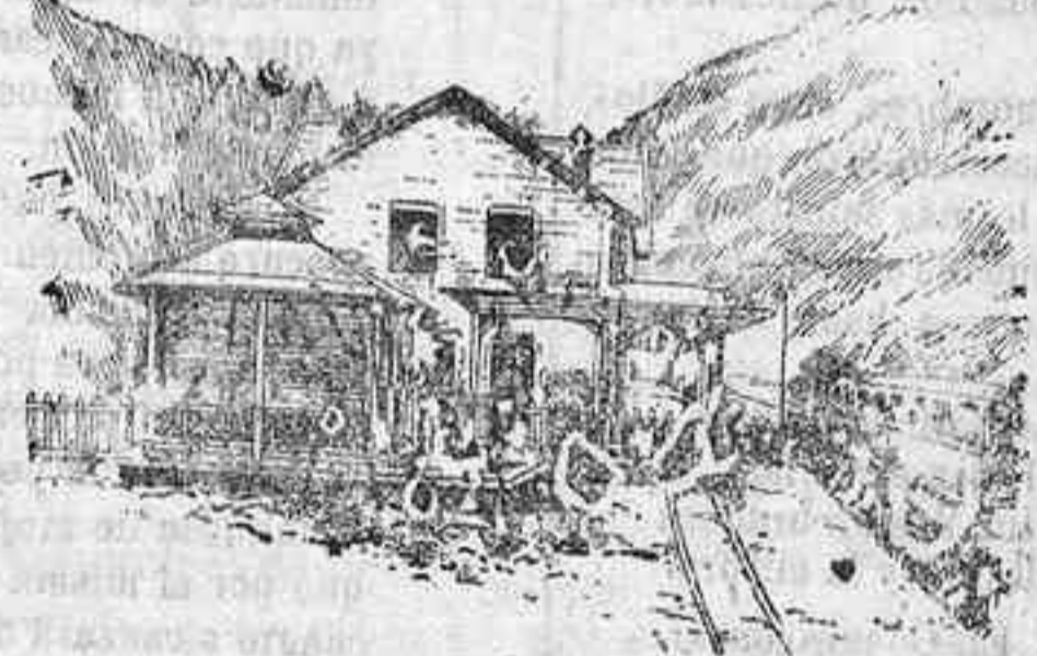
Estación de salida

Por las noticias que llegan hasta nosotros, el dominio de la región alpina de las nieves y de los hielos, con sus cascadas, torrentes y precipicios, no tardará en ser un hecho. Una vía férrea eléctrica remontará al viajero a 4.800 metros de altura. El proyecto de esta vía, debido a un ingeniero francés, no deja de ser sugestivo. Parte el trazado de la estación de Fayet-Saint Gervais (Monte Blanco) y se efectúa el recorrido al aire libre hasta Mont-Lachat. Desde allí hasta la cumbre, por el centro de un túnel, que servirá para proteger la línea contra la furia de los aludes. Al llegar a la altura de 2.640 metros, el convoy recorrerá al aire libre una gran extensión del Mont-Blanc y los pasajeros podrán admirar los magestuosos panoramas de la región alpina.