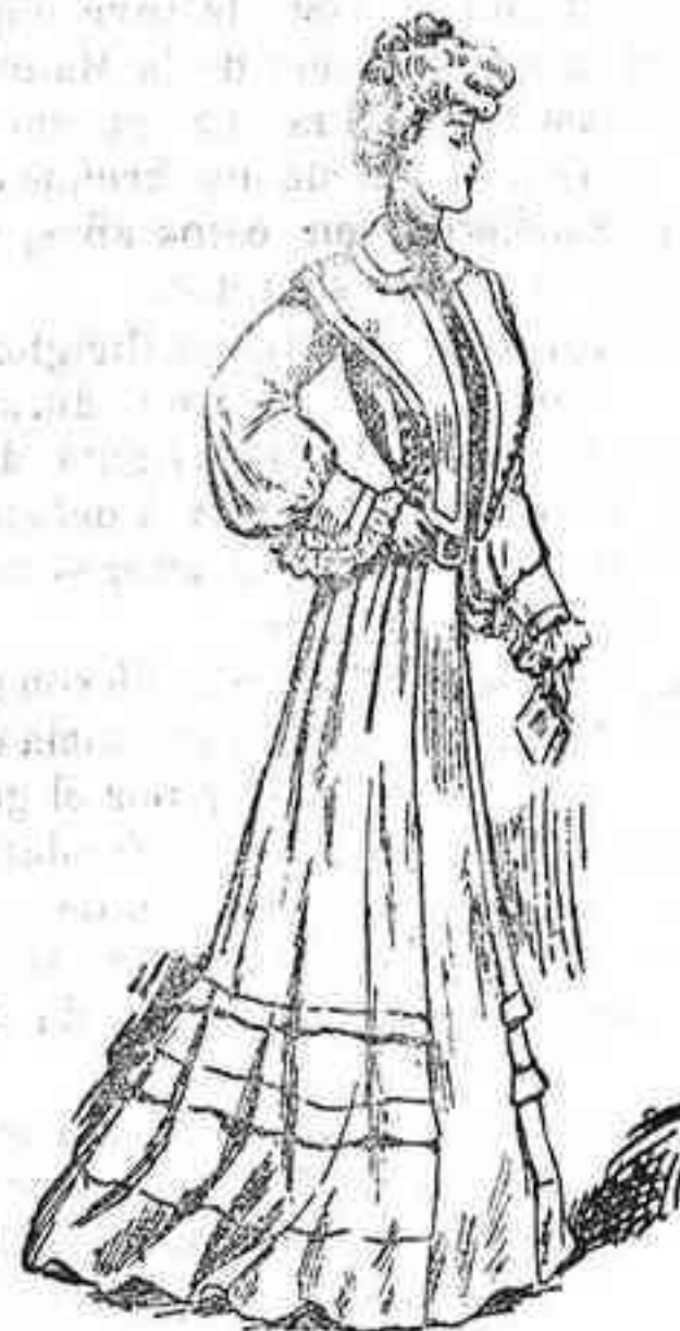
Traje para recibir

De paño satén, color beige. La falda lleva en la parte inferior tres volantes terminados en el paño delantero y pegados con un biés de la misma tela pespunteado. El cuerpo es de forma bolero, abierto sobre un plastrón de terciopelo. Cuello ancho, forma estola, abotado en los hombros y adornado con botoncitos de metal. Un pequeño cuello vuelto y anchos puños rodeados de «plissé» completan este lindo traje.