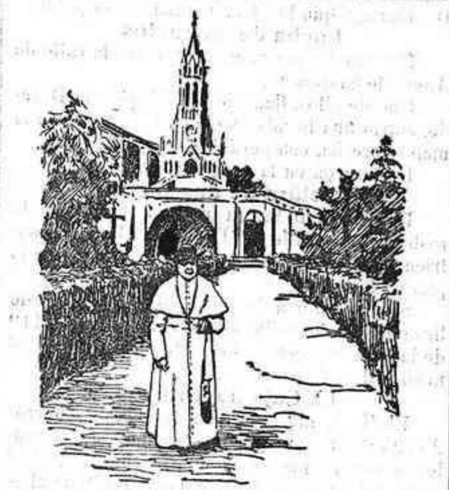
El recreo del Pontífice Su Santidad el Papa Pio X paseando por los alrededores de la Gruta de Nuestra Señora de Lourdes, en los jardines del Vaticano.