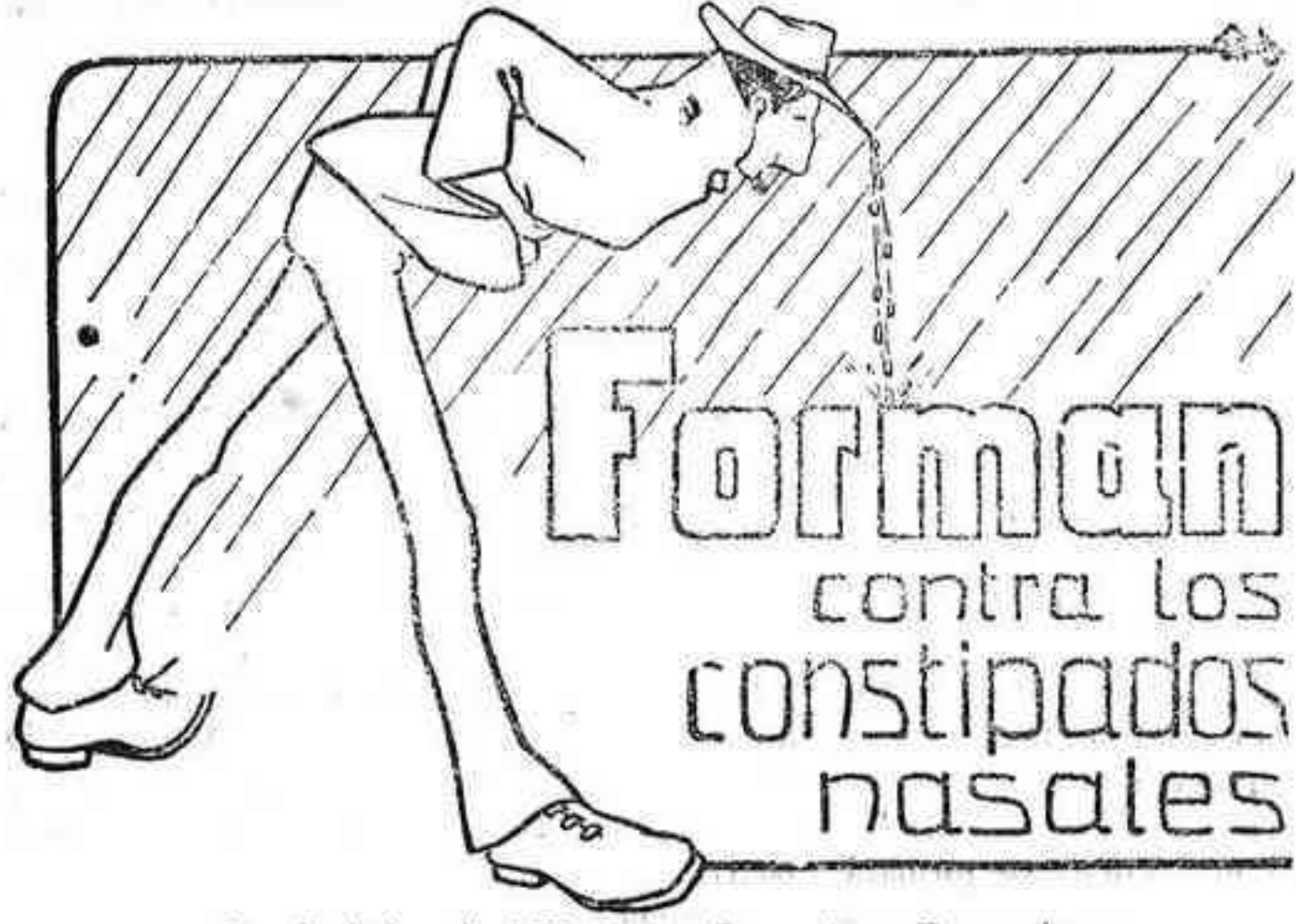
Precio de la caja, 0'75 pesetas. De venta en Farmacias.

Prepara da con Aceite puro de Hígad. de Bacalao, con Hipofosfitos de Cal y Sosa y Guayacol PREMIADA EN LA EXPOSICION DE ALEJANDRIA