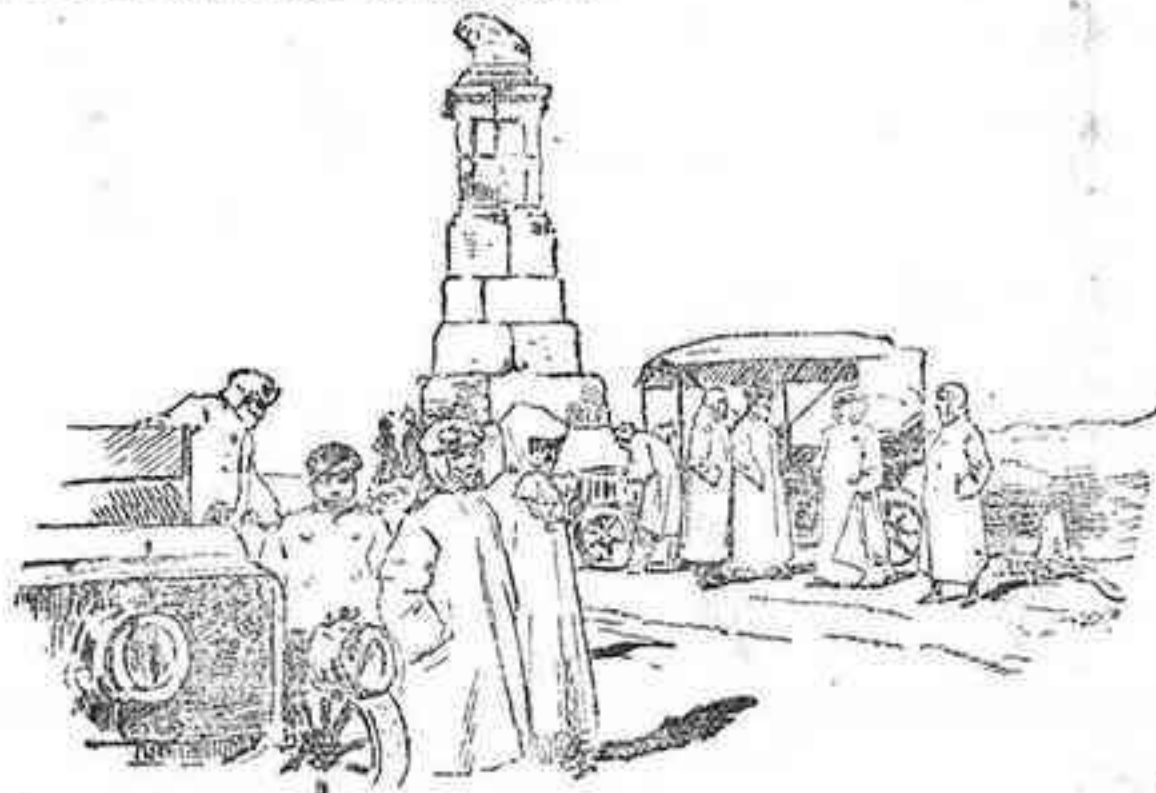
Lugar del puerto de Guadarrama conocido por el Alto del León.