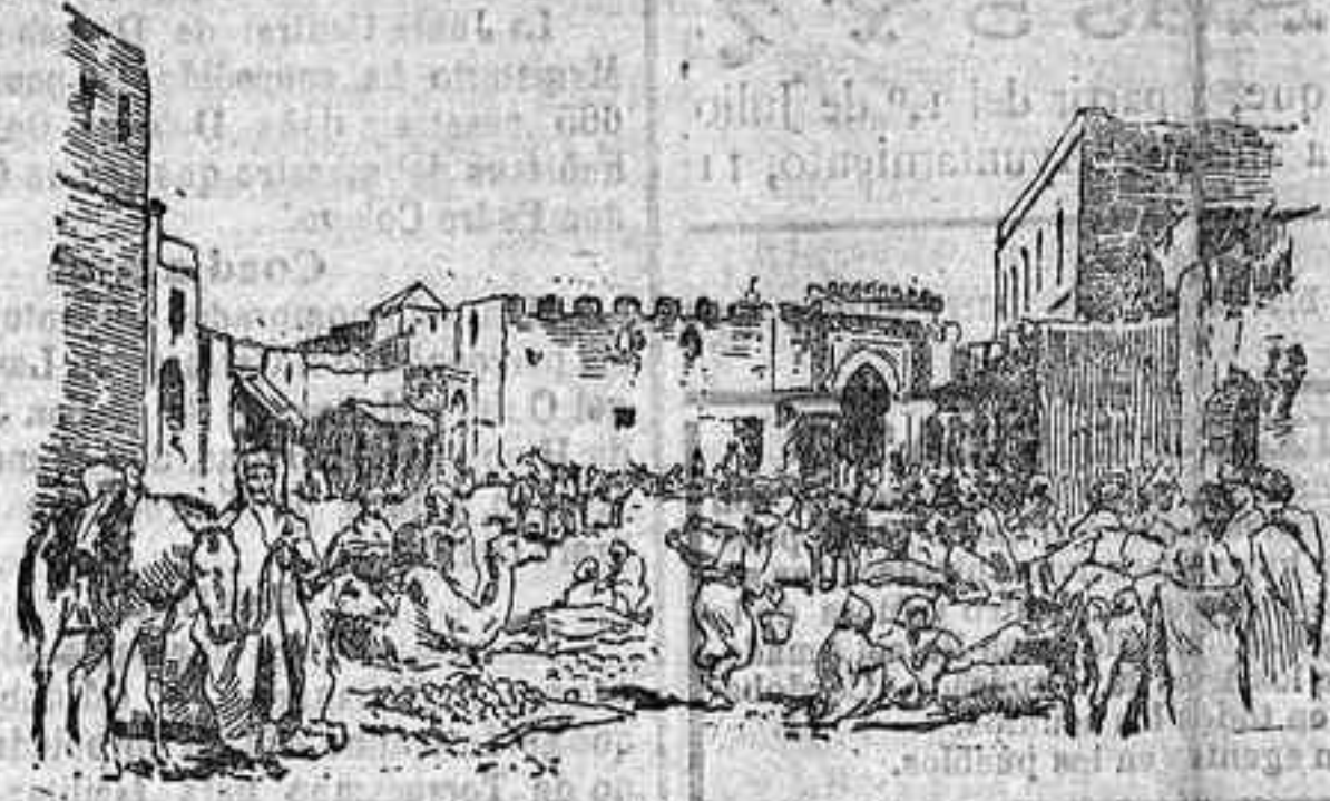
Larache.—El zoológico Grande.