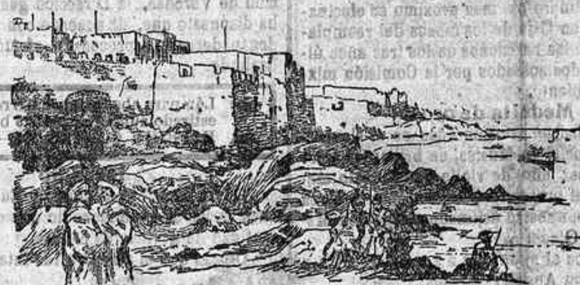
Murallas construidas por los españoles en el siglo XVII

das próximas al Raisuli bnaques, pero no en la misma senda del Raisuli. Antes bien, el camino del Agullocho de Zinat debe ser definitivamente cerrado e inutilizado. En resumen: El Socialista quiere la paz, pero como sea, aunque en ella dejemos jirones de la honra nacional, y nosotros—como la opinión militar—también queremos la paz, pero una paz estable y que nos permita conservar lo frente alta ante el mundo. Entre uno y otro anhelo hay un abismo; por eso ha sido tan brava la caminata que El Socialista ha hecho con La Correspondencia Militar.