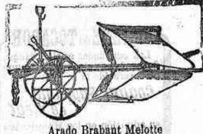
Arado Brabant Melotte

ARADOS Brabant MELOTTE y RUD-SACK . CULTIVADORES Planet.— GRADAS de muelle. SEBRADORAS "San Bernardo", con cajón. DISTRIBUIDORA de abonos.— TRITURADORES de Grano— Abono y CORTA-FORRAJES .