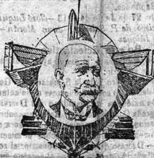
El conde Zeppelin

El conde Zeppelin, el famoso inventor de los globos dirigibles que llevan su nombre, se dispone a efectuar la travesía del Atlántico en uno de sus aerostatos más perfeccionados.