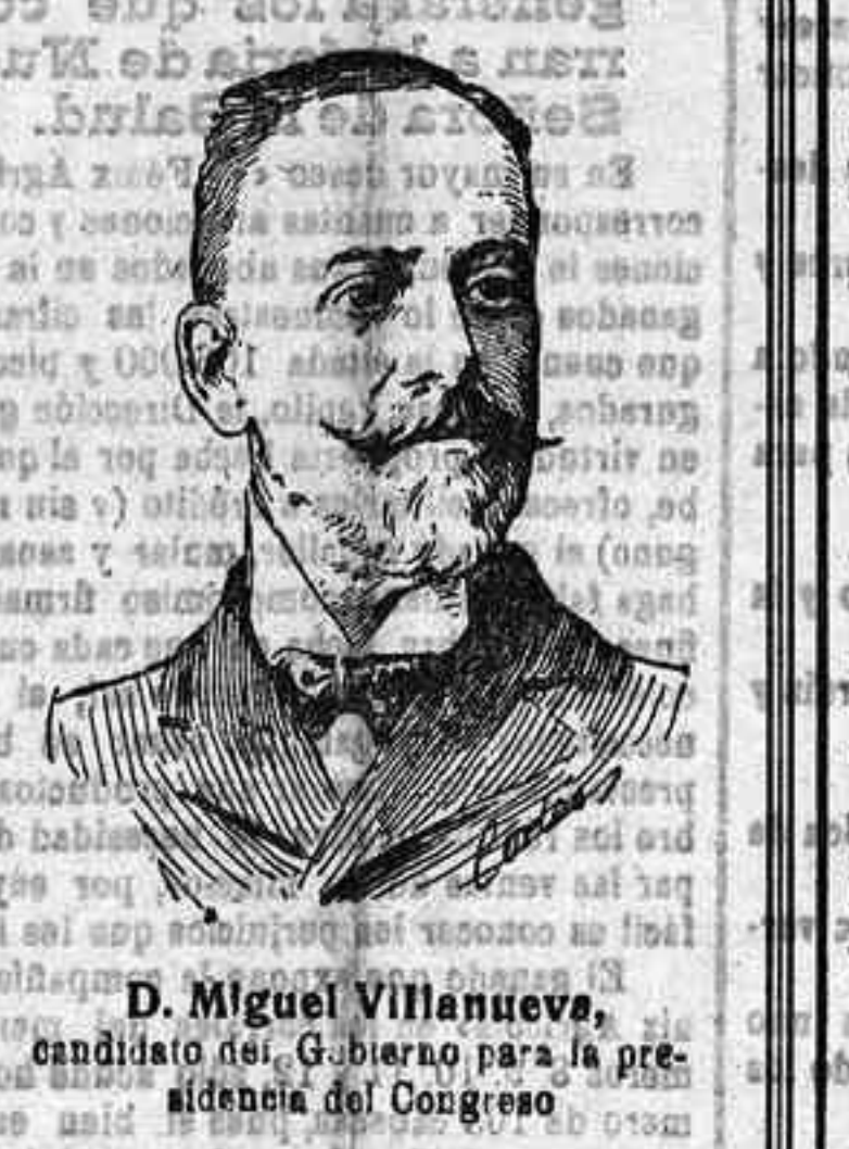
D. Miguel Villanueva, candidato del Gobierno para la presidencia del Congreso

Animación extraordinaria Con una animación extraordinaria, que supera en mucho a la de los años anteriores, empezó y va nuestra incomparable feria de Nuestra Señora de la Salud. El hermoso tiempo que disfrutamos contribuyó notablemente a que en el real de la feria como en las calles del Conde de Gondomar y de la Concepción no se viera más que un hormigueo de gente que iba y venía en distintas direcciones. La animación fue creciendo poco a poco desde las siete de la mañana, hora en que fuimos al real de la feria. El ganado Según nos manifestaron en el local destinado a la expedición de ganados, se habían extendido hasta el medio día veinte, en su mayoría de ganado sanar. Algunos inteligentes nos manifestaron que se presenta una buena feria. El ganado está situado en el mismo lugar que en los años anteriores. En general hay muchísimo, si bien escasea el de cerda. El que más abunda es el mular y también el vacuno, del que vimos preciosos ejemplares. Hablamos con varios tratantes, quienes nos manifestaron que los tratos escaseaban pues, como primer día, únicamente se dedicaban al tanteo. Sin embargo, presentamos la venta de dos mulos a 2 800 reales cada uno y otros varios de burras y burros de cuatro a cinco años a 30 y 35 duros.