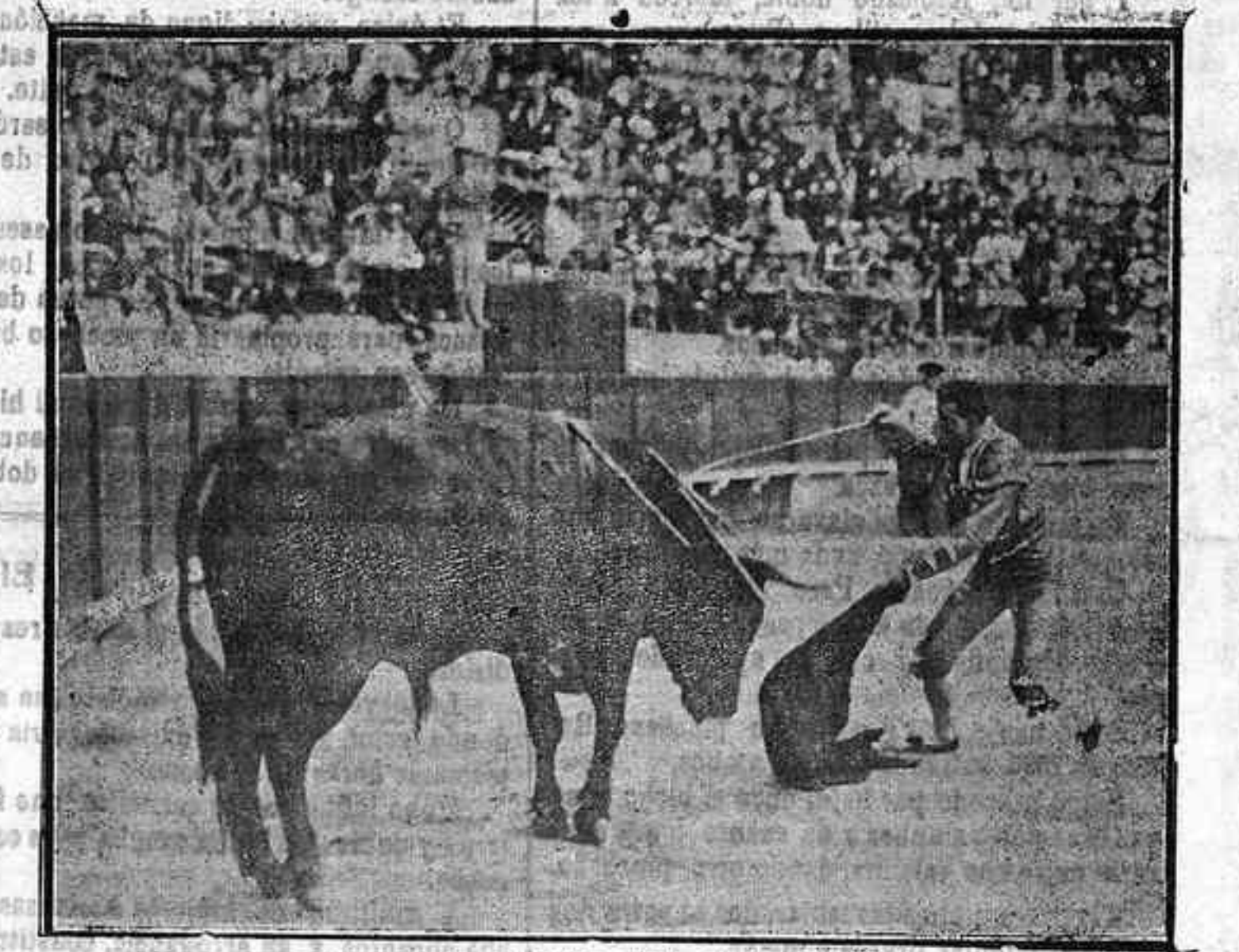
PHOTO MADRID MANTANDO AYER AL CUARTO TORO