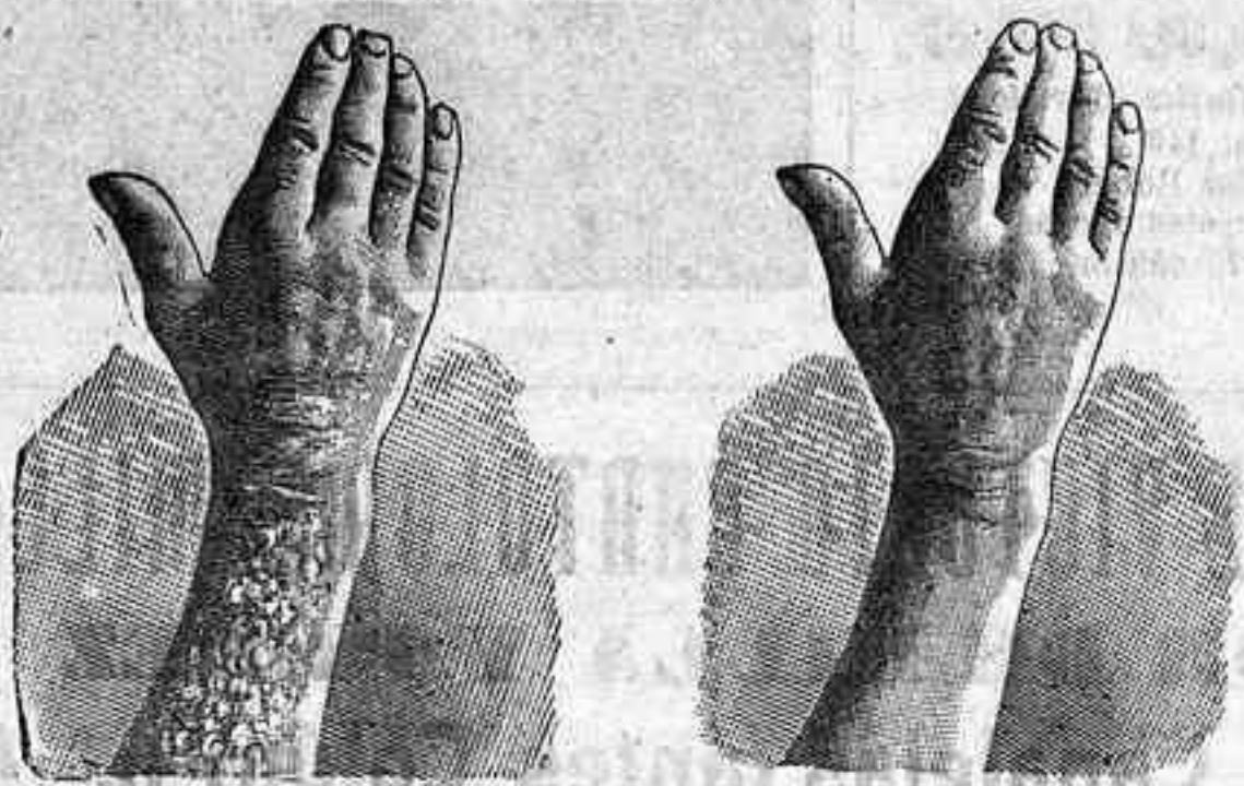
Antes de la curación. Después de 15 días de tratamiento

Curación de las enfermedades de la piel y también de llagas de las piernas LA SANGRE