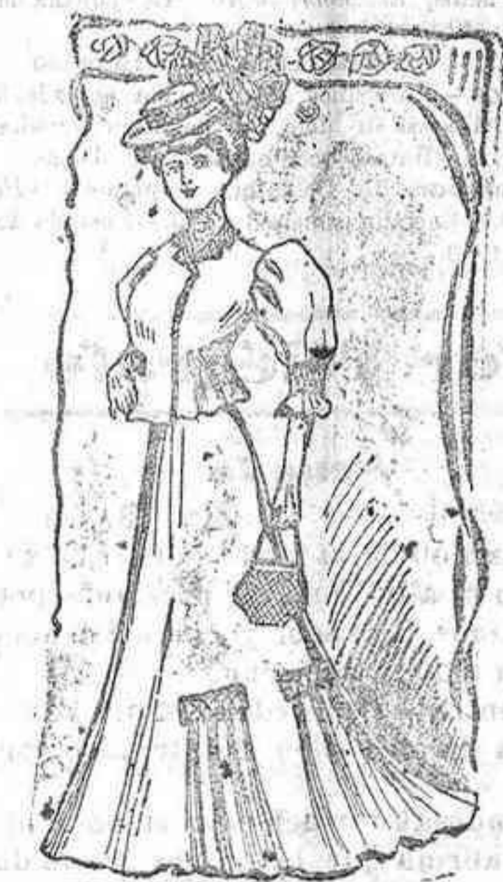
Traje para campo

De sarga azul marino. Bonita falda adornada con dos cuadradas de terciopelo asociadas con pespunte al sesgo en cada lado de ella, y los cuales sirven para recogerla en cuatro pliegues simétricamente colocados.