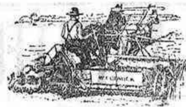
Alfadoras Macormick — ULTIMA PERFECCION —